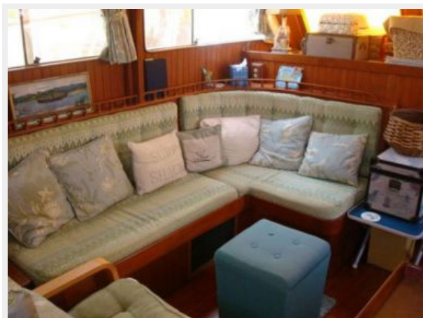
41' DeFever salon seating photo1