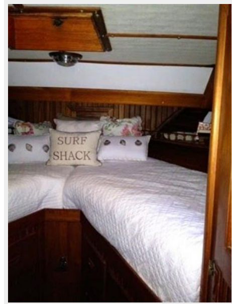
41' DeFever guest stateroom