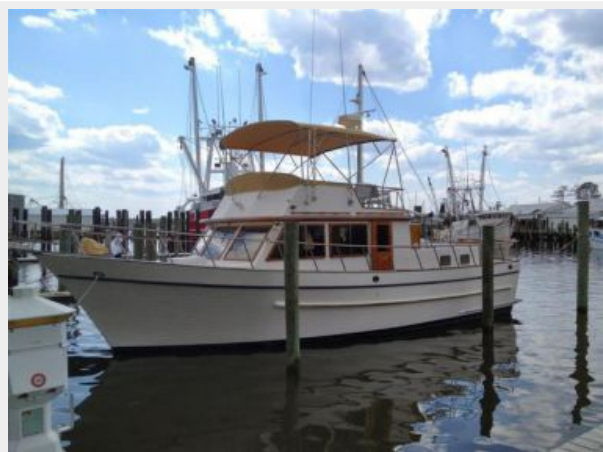
41' DeFever port profile