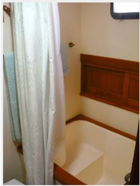
41' DeFever master stateroom tub-shower