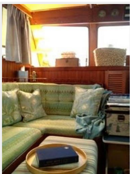
41' DeFever salon forward