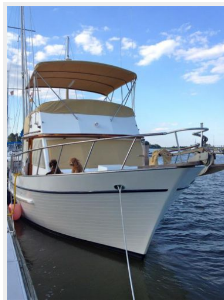
41' DeFever forward profile