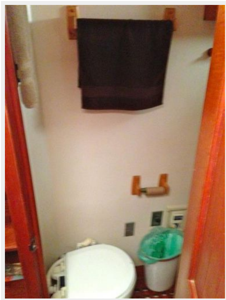
41' DeFever guest stateroom head