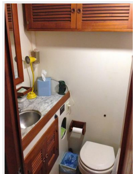
41' DeFever master stateroom head