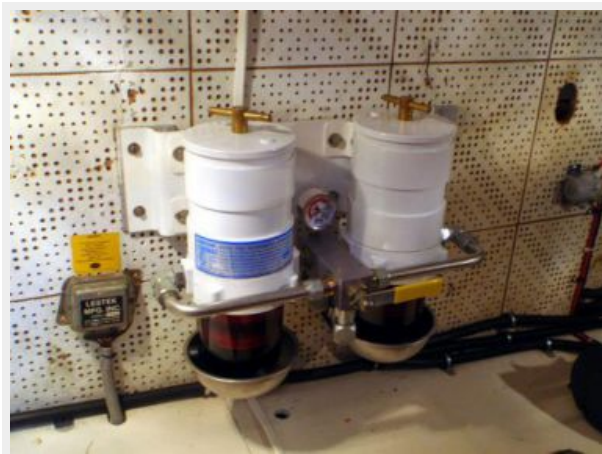
41' DeFever Racor fuel filters