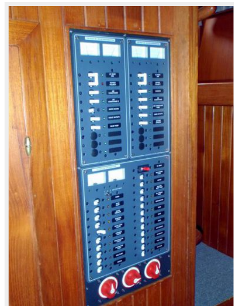
41' DeFever electrical panel