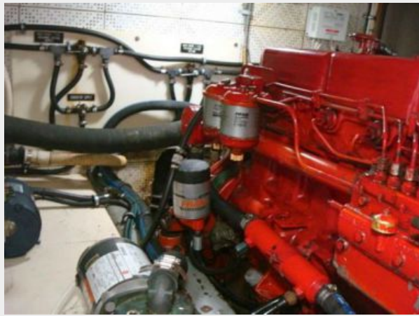
41' DeFever engine room starboard aft