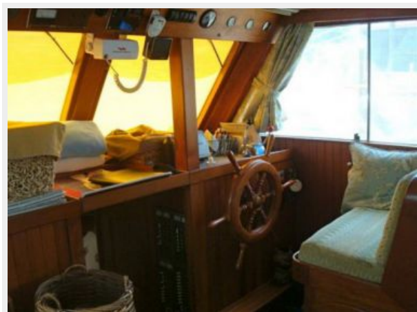
41' DeFever lower helm photo1