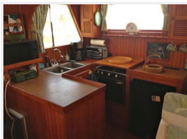
41' DeFever galley photo1