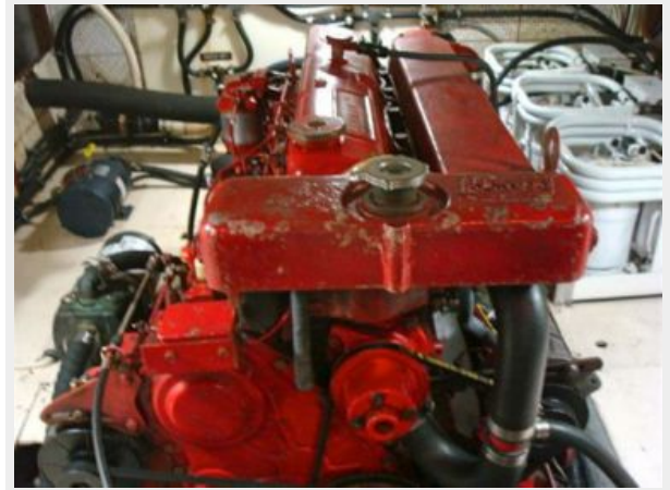
41' DeFever main engine