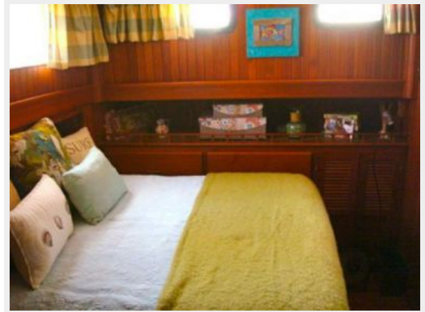
41' DeFever master stateroom head