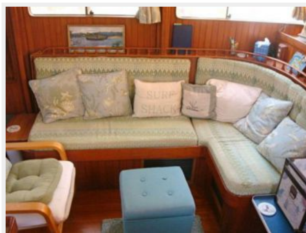
41' DeFever salon seating photo2