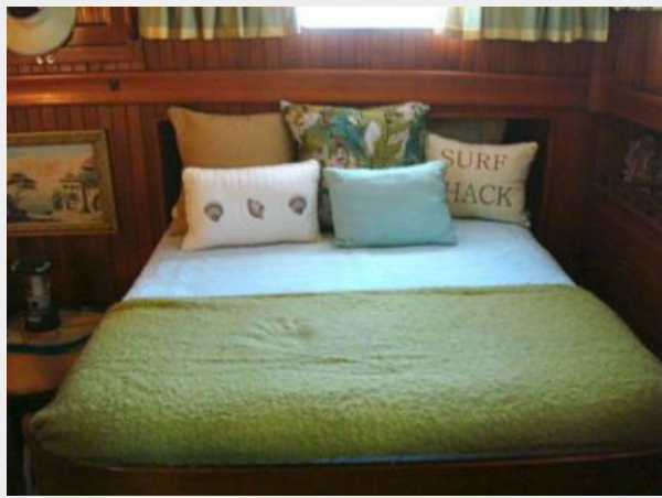
41' DeFever master stateroom