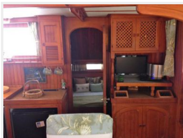
41' DeFever galley photo2