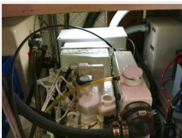
41' DeFever generator