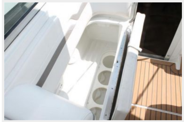
In Floor Ski Storage