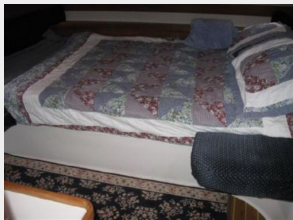
Aft Master Stateroom