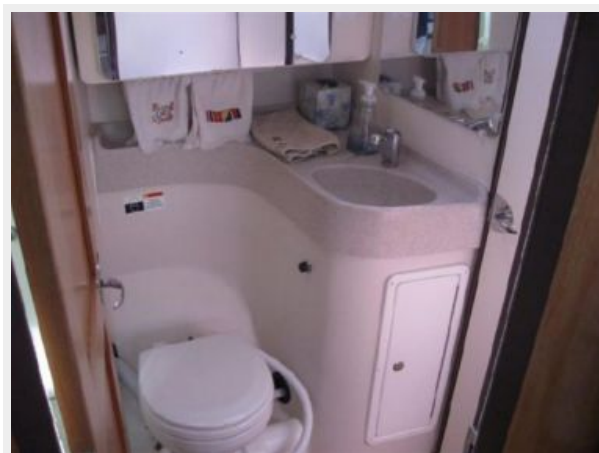
Head entry from Main Salon