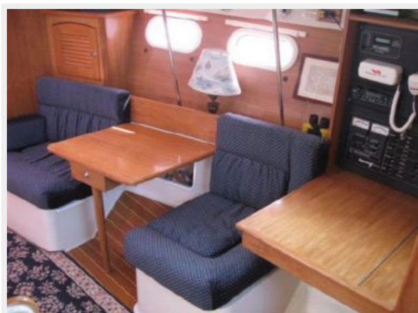
Sbd. Setee w/Convertible Table