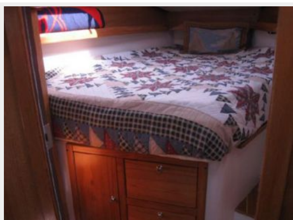
Forward Pullman Berth w/storage