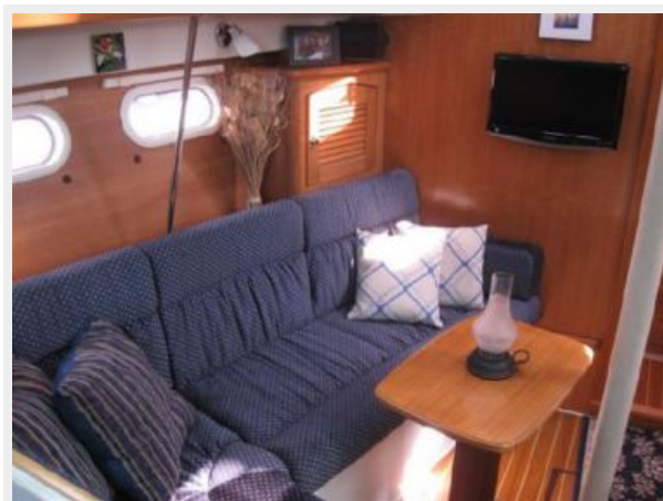
Port Settee and Dining Table