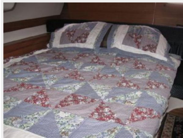
Aft Stateroom looking to Port