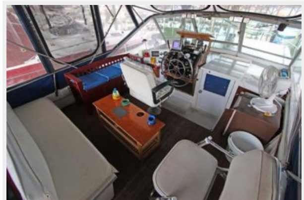
Spacious Flybridge W/Lots Of Seating