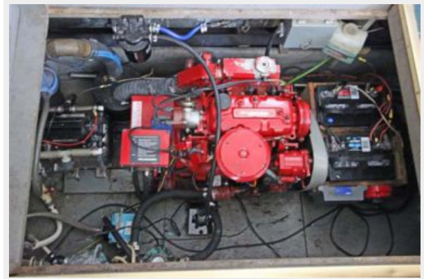
4.5 KW Westerbeke Generator (New 2003)