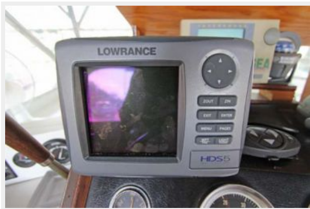
Lowrance Radar/Bottom Machine