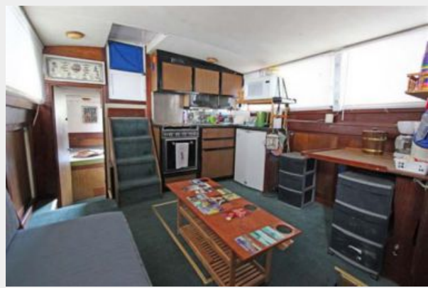
Salon Looking Aft