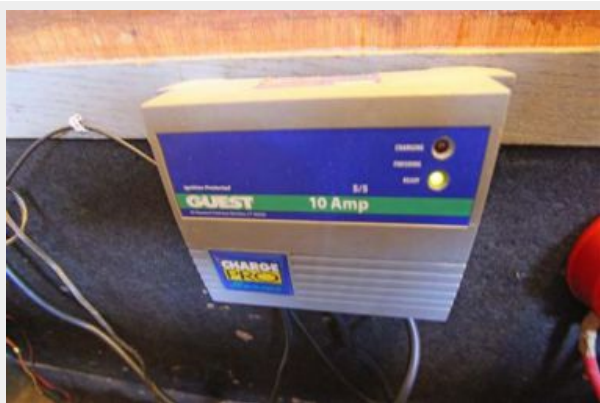
2-Guest 10 Amp Battery Chargers