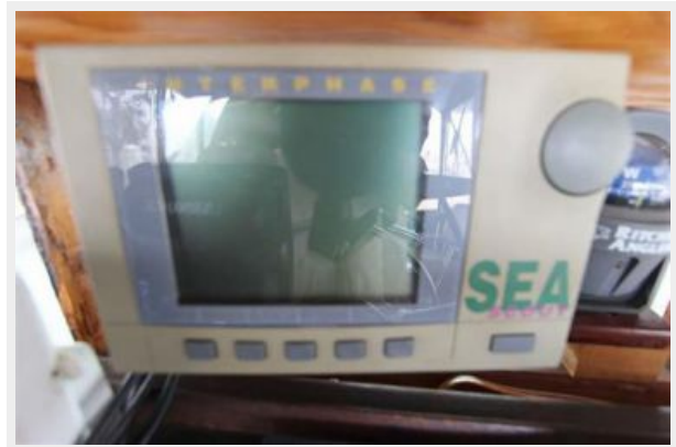
Interphase Sea Scout Forward Looking Sonar