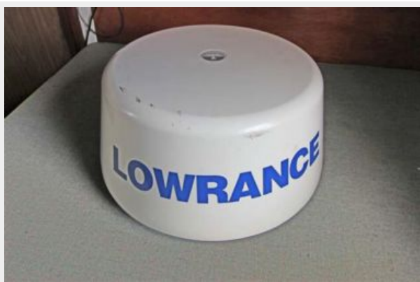
Lowrance Closed Array Radar (Easily Connects & Disconnects To Fit Into Owners Covered Slip)