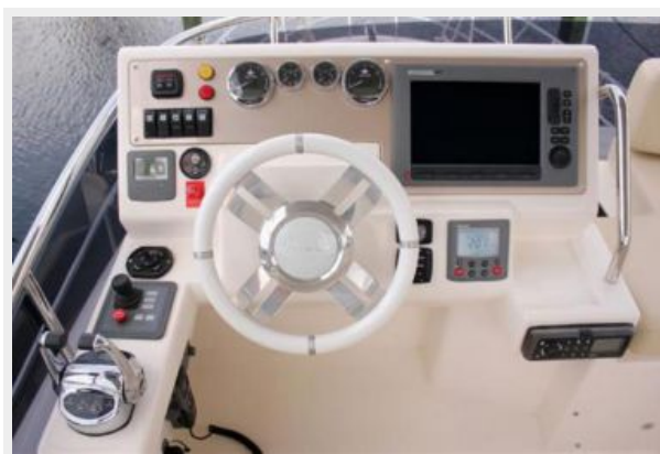
Flybridge Helm Station