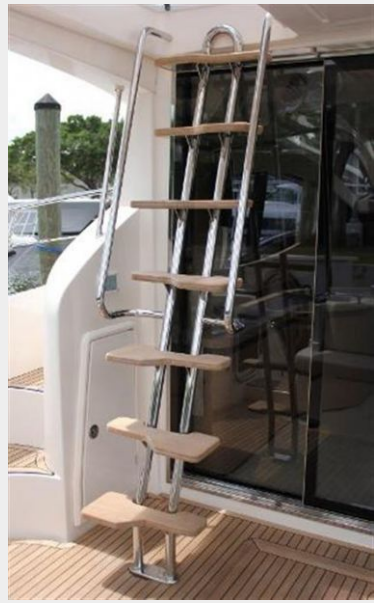
Stairs to Flybridge