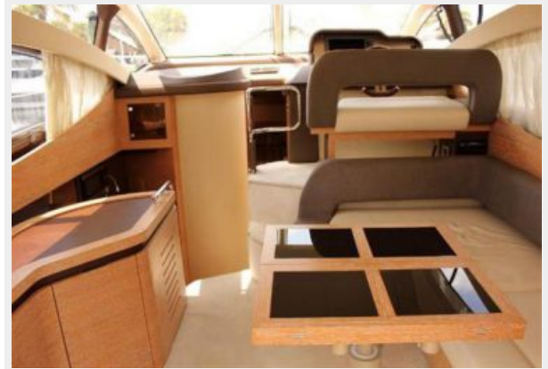
Salon Looking forward to Helm Station