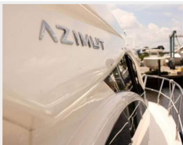
38 Azimut Fly