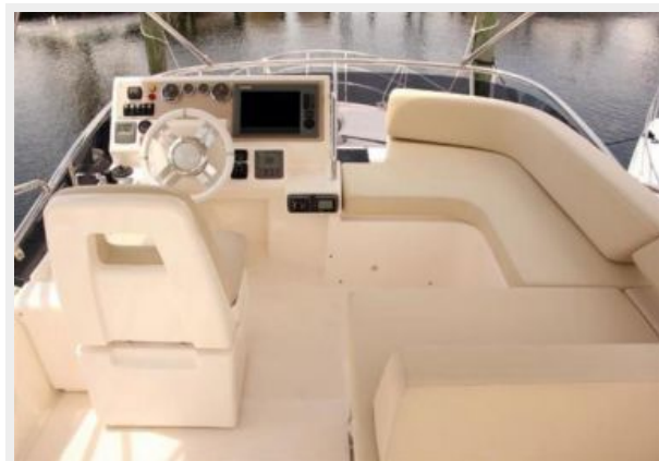
Forward Flybridge Seating