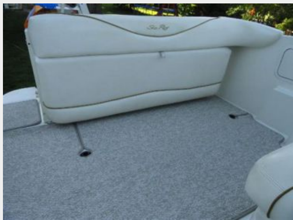
Aft Seating folded down