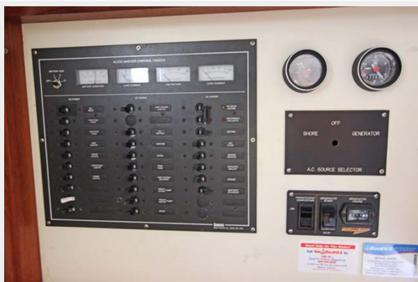
AC/DC Electrical Panel