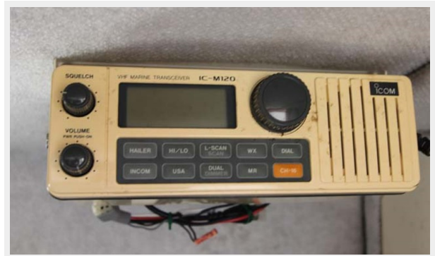
ICOM IC-M120 Marine VHF Radio Mounted In Salon