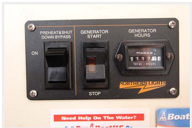
Northern Lights Generator Control & Hour Meter 117 Hours