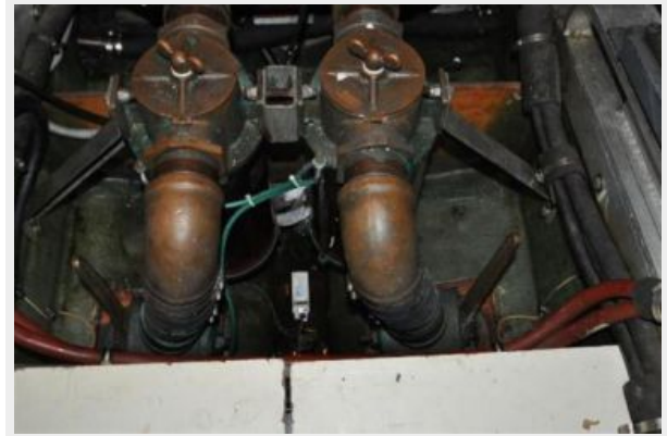
main engine intakes