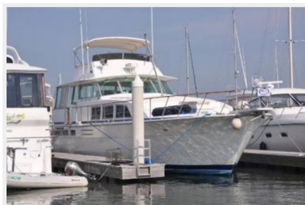
hailed profile (1/2014)