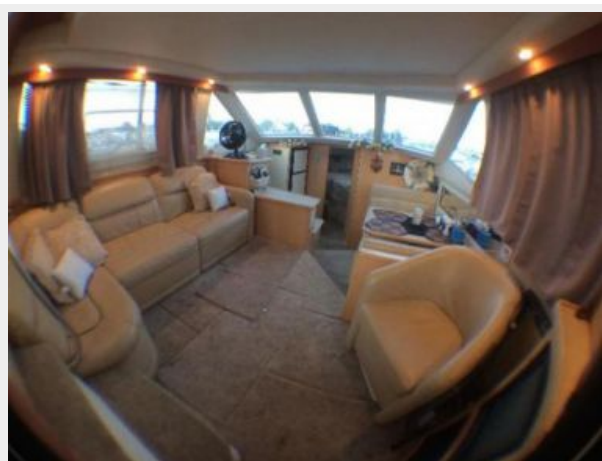
Facing Forward in Salon