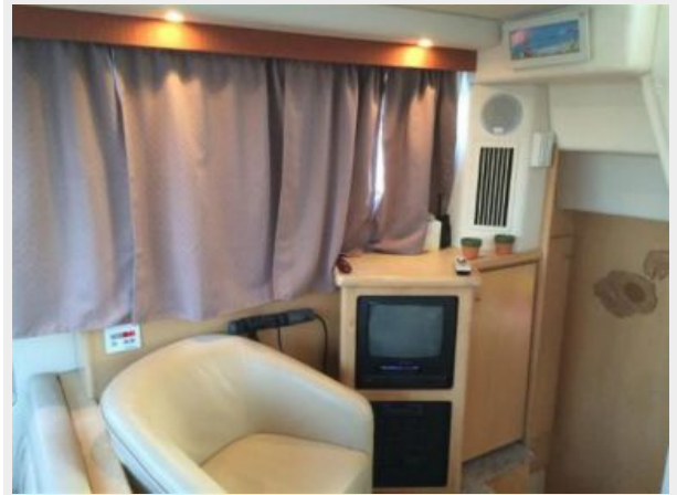
Facing Starboard in Salon