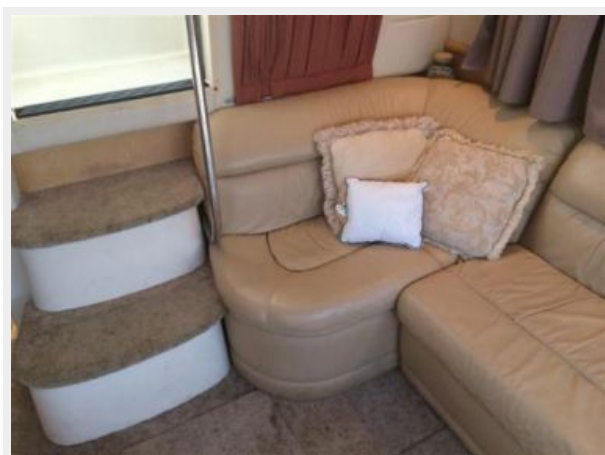
Facing Aft in Salon