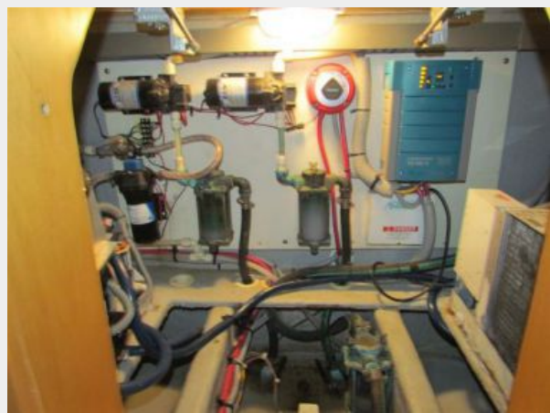
Equipment under stairs