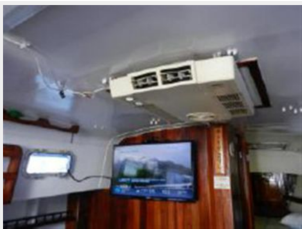
RV Type Air Conditioning Flatscreen TV