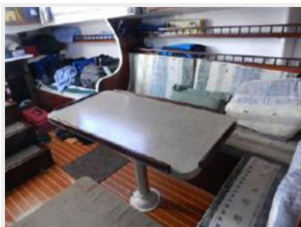
Port Salon and Quarterberth