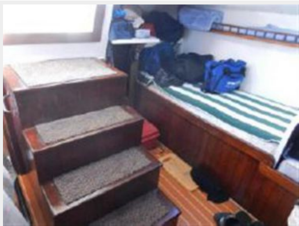
Port Quarter Berth