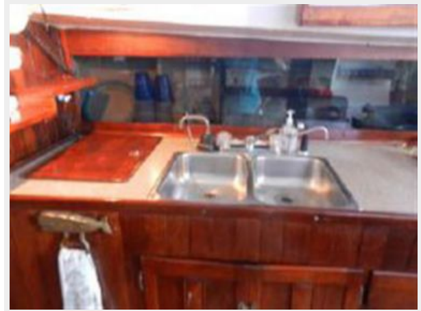
Refrigerator and Double Sinks