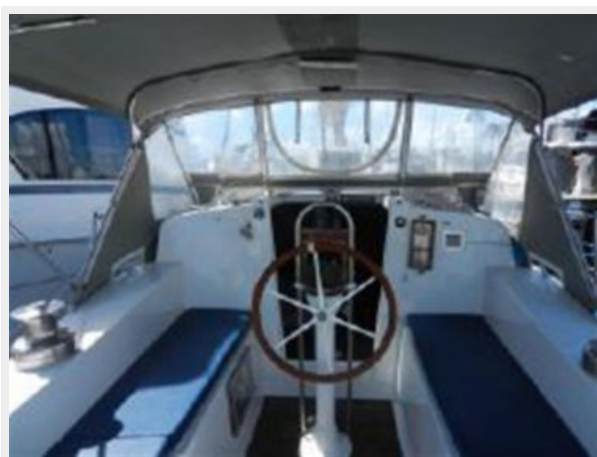
Dodger and Bimini