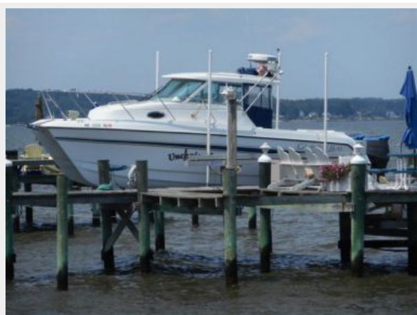
26' Glacier Bay port profile