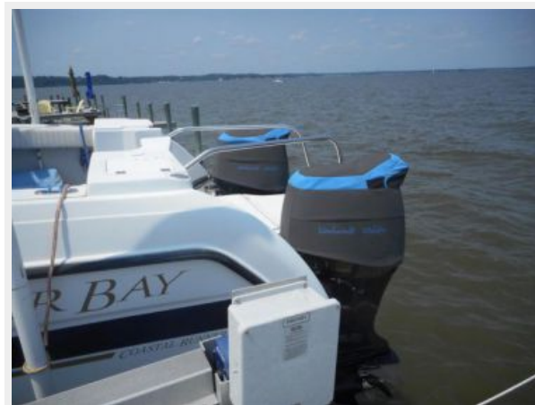
26' Glacier Bay outboards