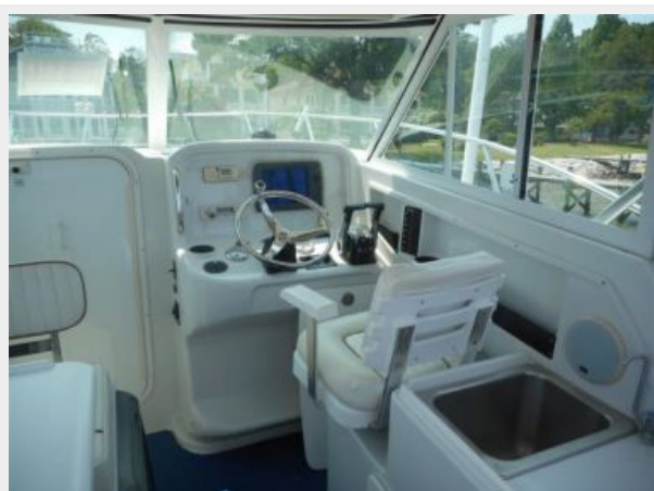
26' Glacier Bay upper deck forward