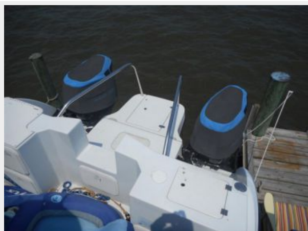
26' Glacier Bay swimplatform