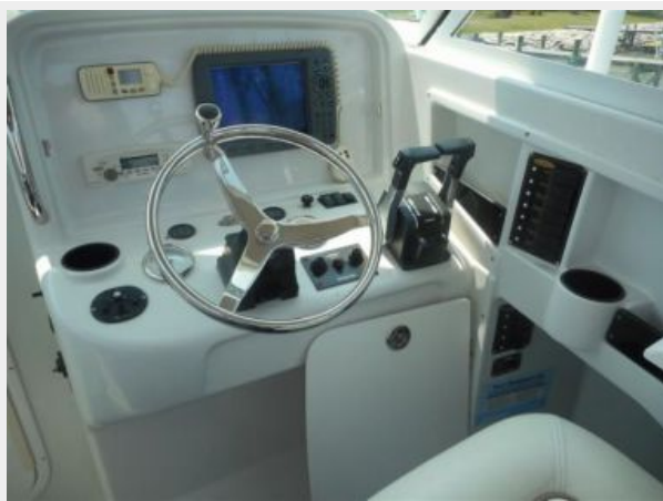
26' Glacier Bay helm