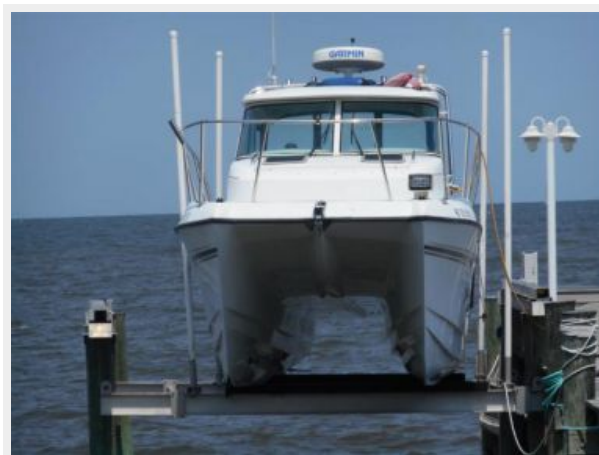
26' Glacier Bay forward profile