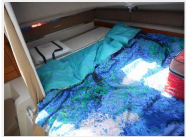
26' Glacier Bay stateroom photo1