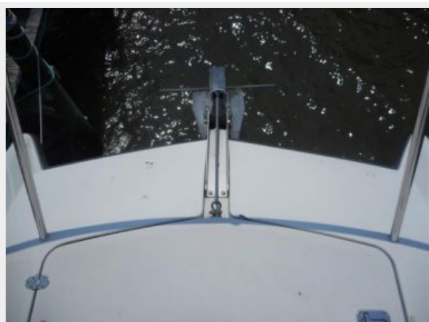
26' Glacier Bay foredeck