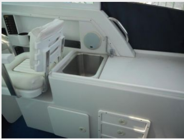
26' Glacier Bay upper deck starboard