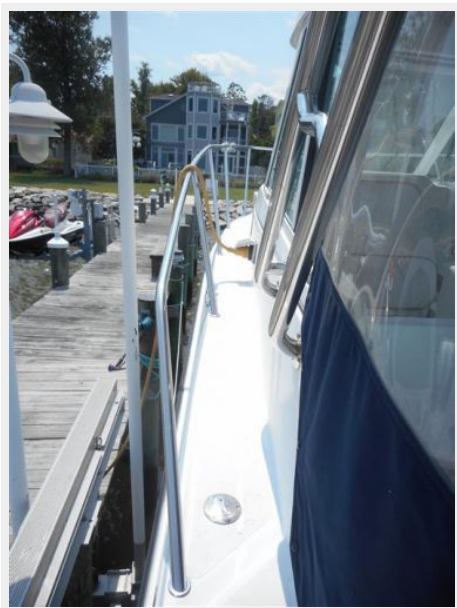
26' Glacier Bay port side deck