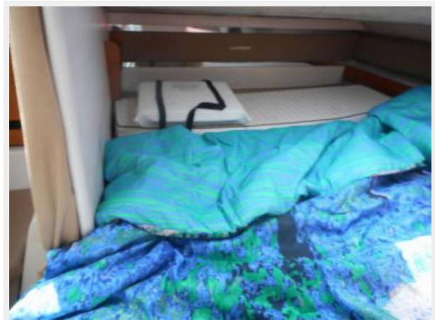
26' Glacier Bay stateroom photo2