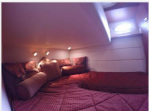
Port Guest Stateroom