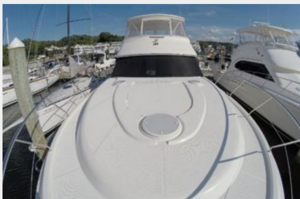
Bow facing aft