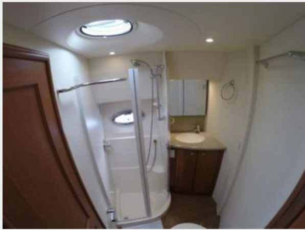
Day Head / Shower - Port Side