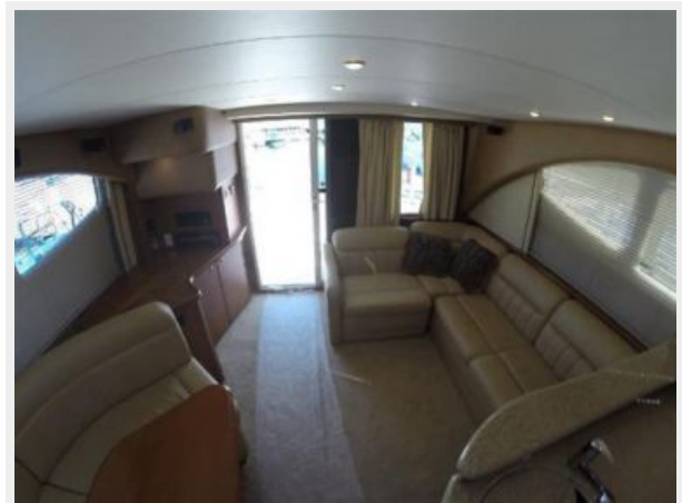
Salon Facing Aft