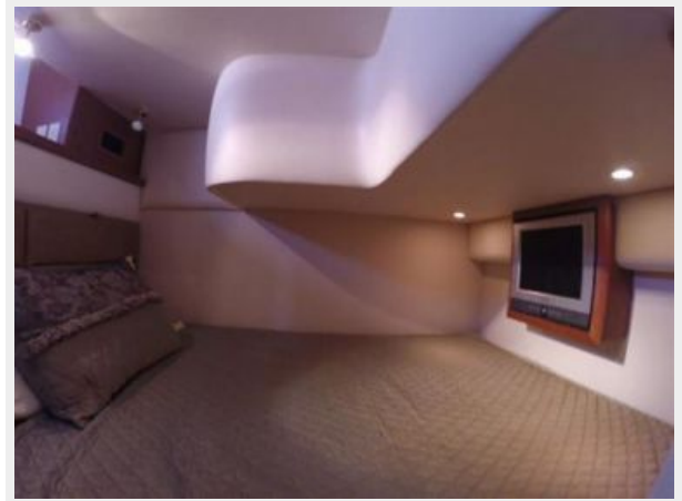
Starboard Guest Stateroom