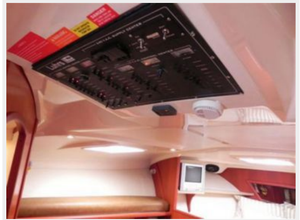
Overhead electrical panel