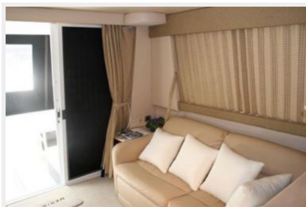
Salon Seating 2