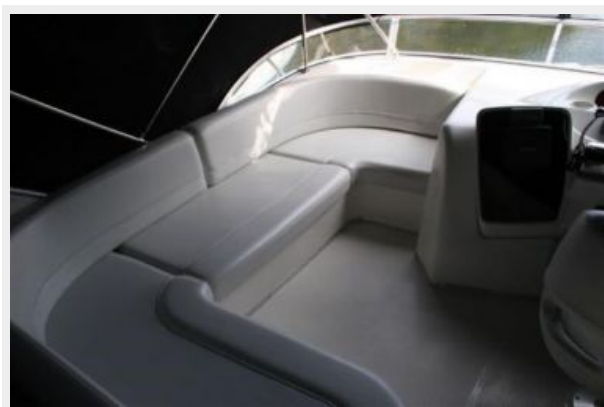
Flybridge seating 2