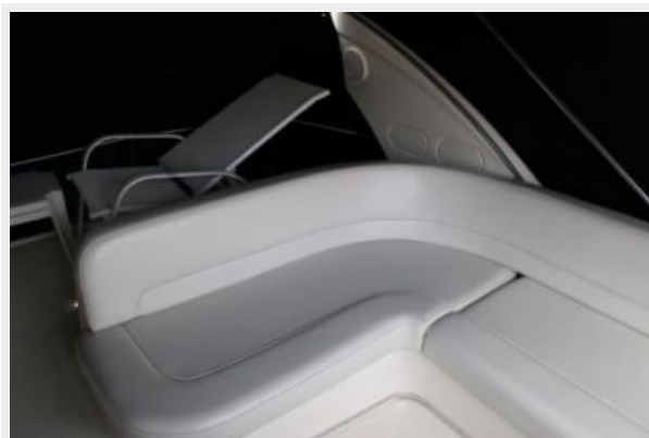
Flybridge seating 1