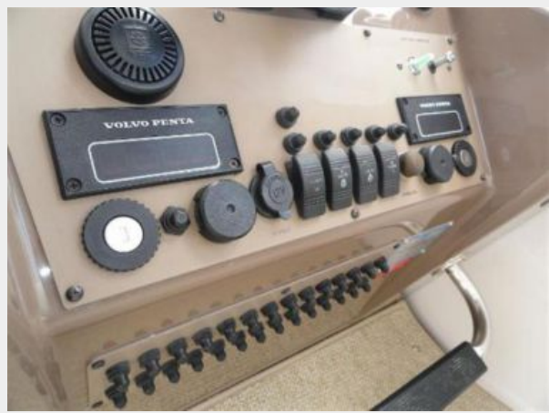
Helm Station 2