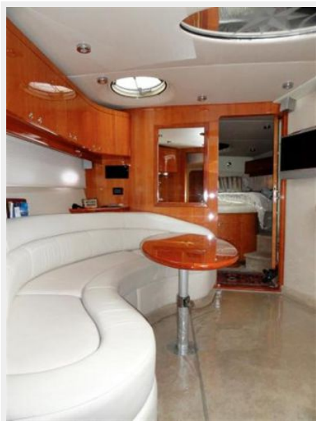
Salon View to Master Stateroom