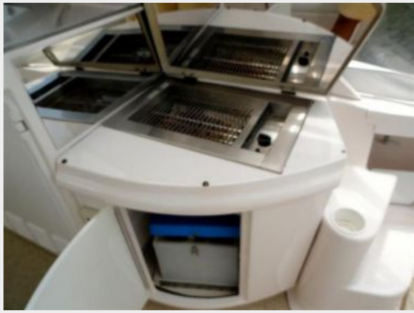
Cockpit Galley 3