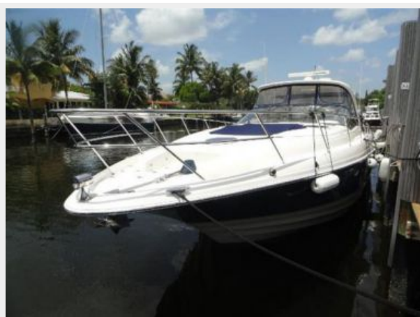
Port Side Bow View