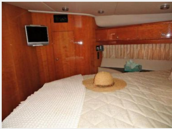
Master Stateroom 2