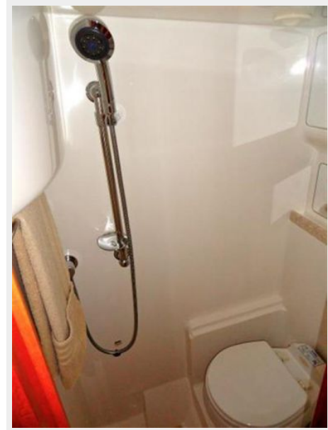
2nd Stateroom Head