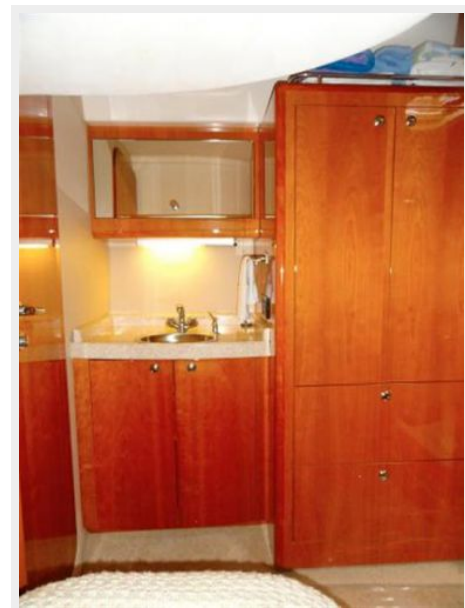
2nd Stateroom 3