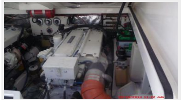
Engine & Mechanical Equipment 1