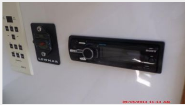
Helm / Electronics & Navigation 6