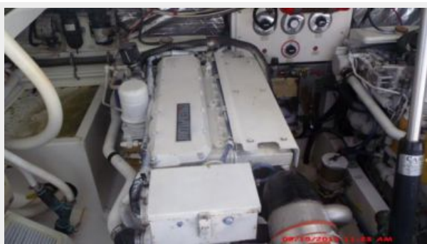
Engine & Mechanical Equipment 2