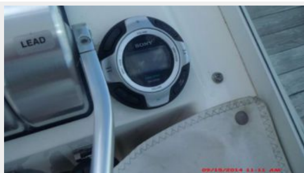
Helm / Electronics & Navigation 4