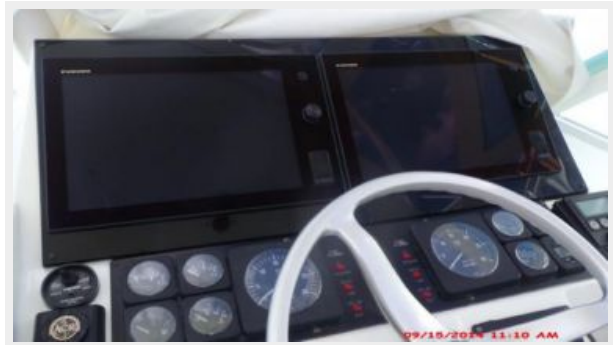
Helm / Electronics & Navigation 1