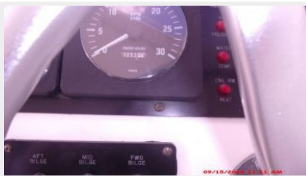
Helm / Electronics & Navigation 2