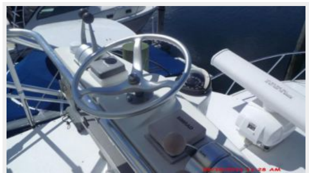
Helm / Electronics & Navigation 9 - Tower Controls