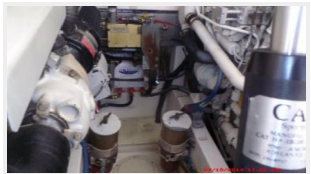
Engine & Mechanical Equipment 5