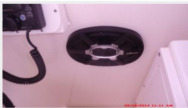
Helm / Electronics & Navigation 8