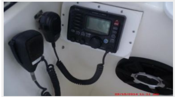
Helm / Electronics & Navigation 7