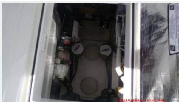
Engine & Mechanical Equipment 6