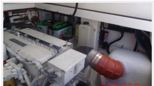
Engine & Mechanical Equipment 3