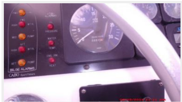
Helm / Electronics & Navigation 3