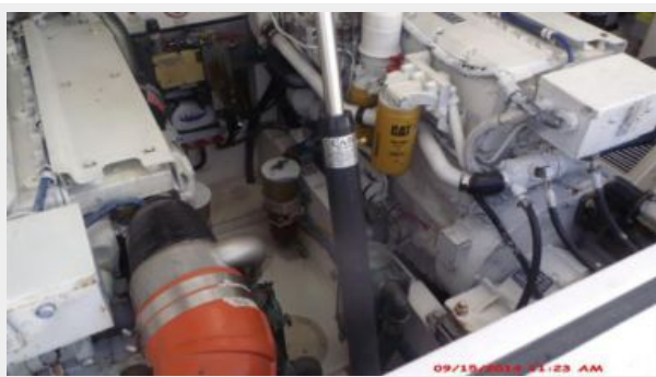
Engine & Mechanical Equipment 4