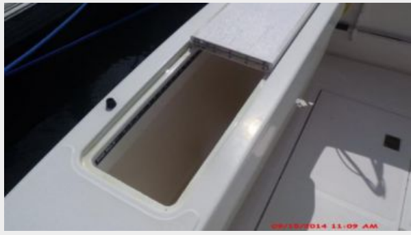
Cockpit / Fishing Equipment 5