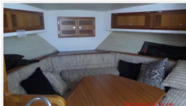
Main Cabin 1