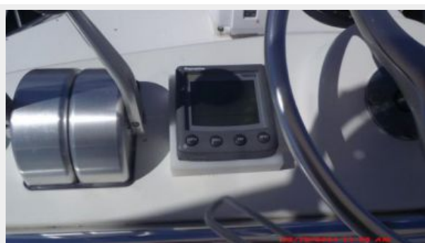
Helm / Electronics & Navigation 10 - Tower Controls