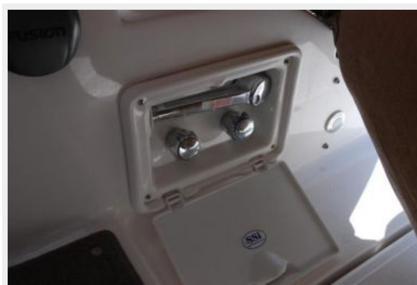
Hot/Cold Transom Shower