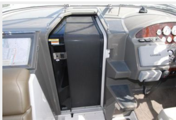
Large Door with sliding screen door