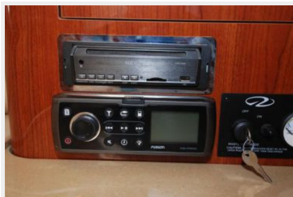
Fusion stereo/DVD player