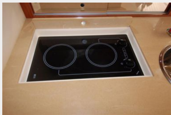
Two burner electric stove