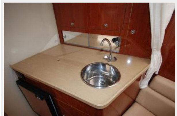
stainless steel sink