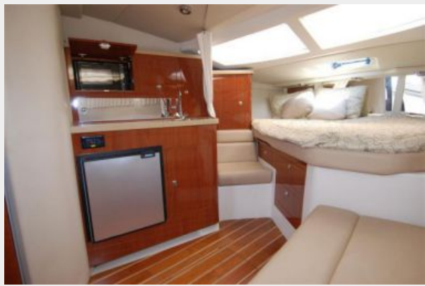
Fridge nice lighting