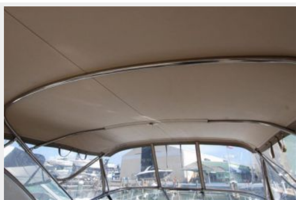
Nice bimini top