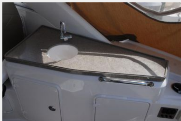
Wet Bar with sink and storage