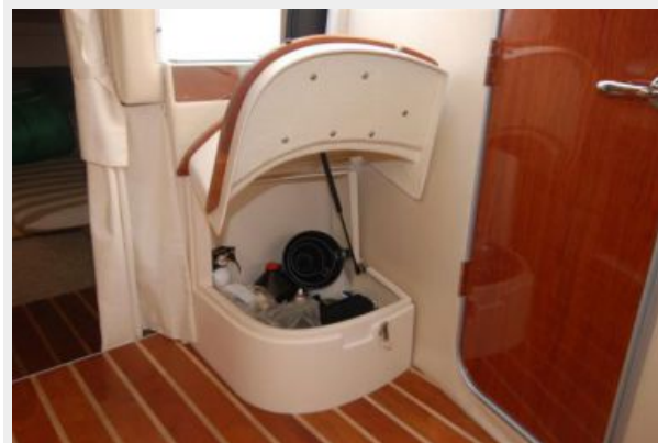
Storage under steps