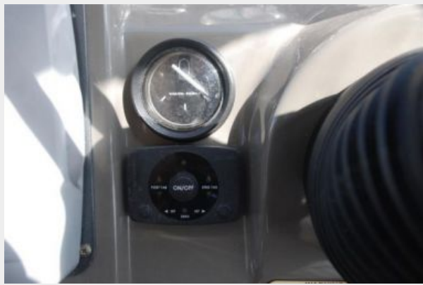
Trim Tab indicator and on/off switch