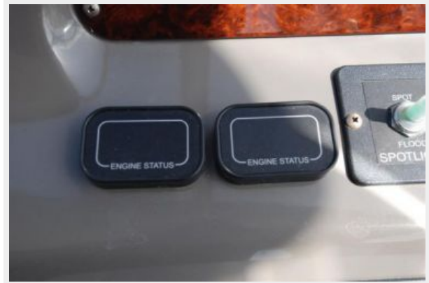
Engine Status Read outs