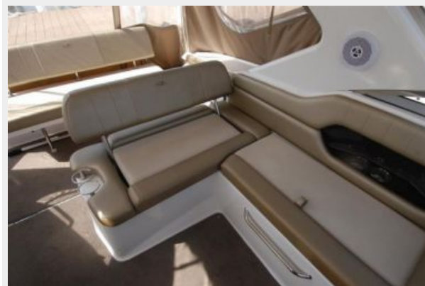
Adjustable Seat facing forward or aft