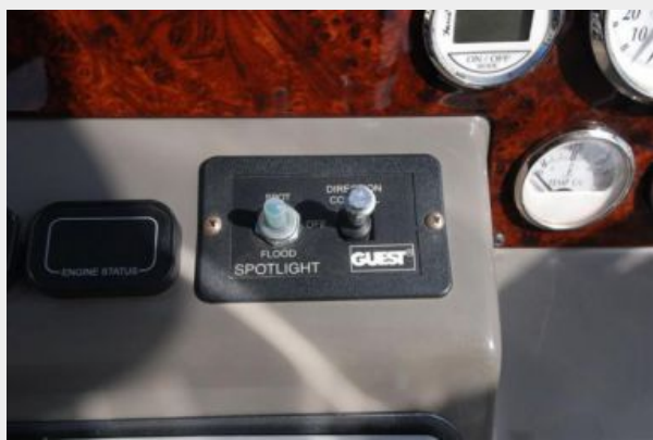
Spot light control