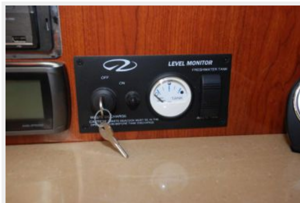
Fresh Water tank monitor