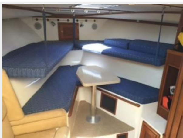
Main Cabin 1