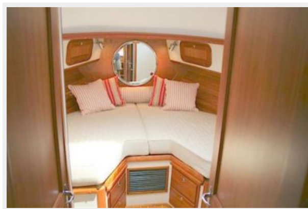
bow berth as V, 2 singles