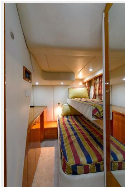
Port Guest Stateroom