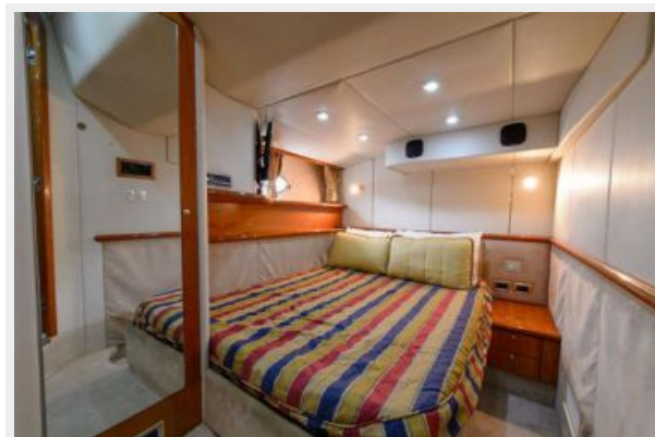
Port Guest Stateroom