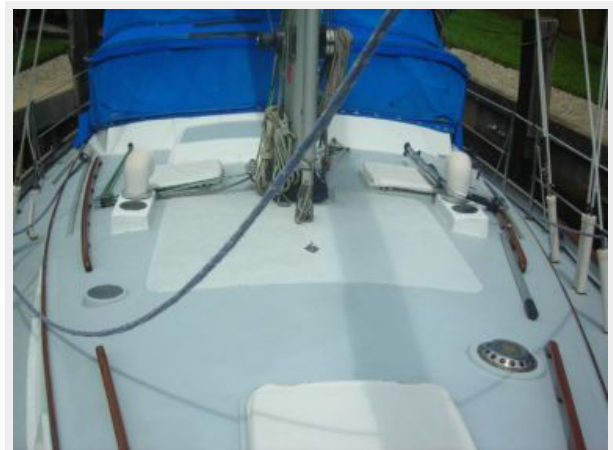
Large cabin top area