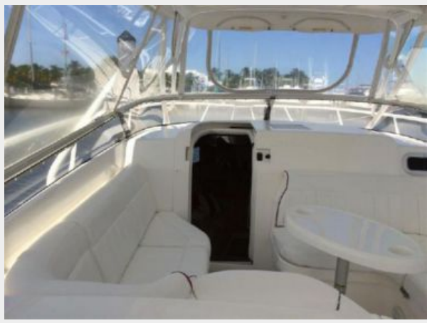
Forward Seating Companionway into Salon