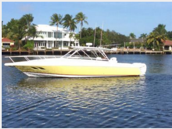
Port Side View