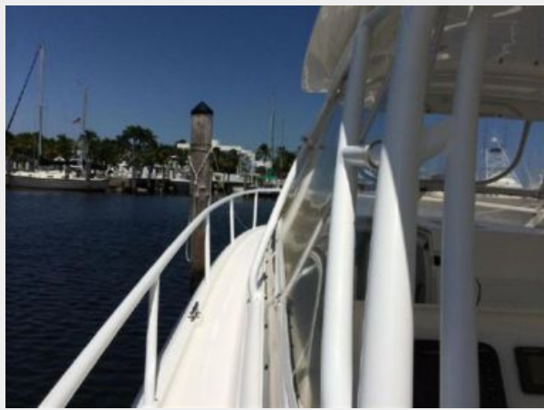
Port Side Companionway