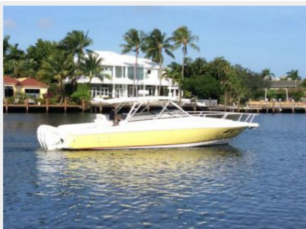
Starboard Side View w/ Dive Door