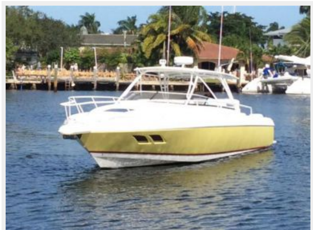
Port Forward Profile