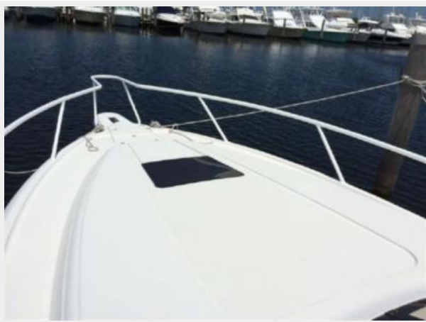
Bow with Windlass Anchor