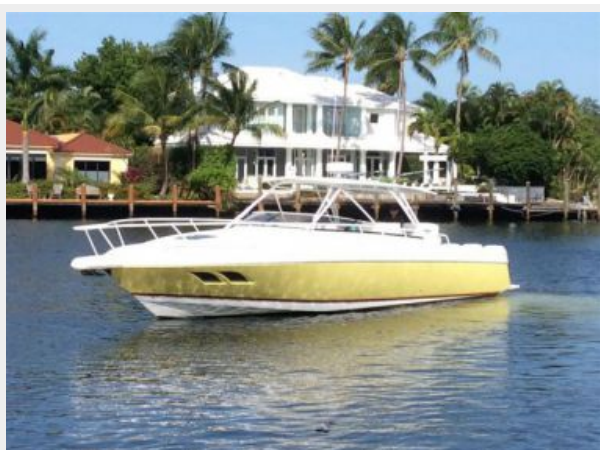
Port Side View