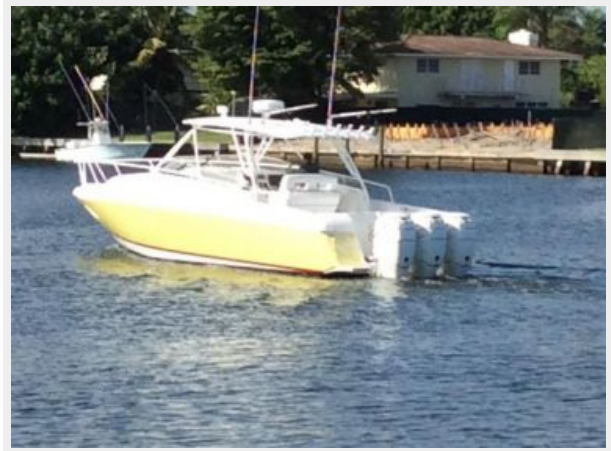
Port Stern View