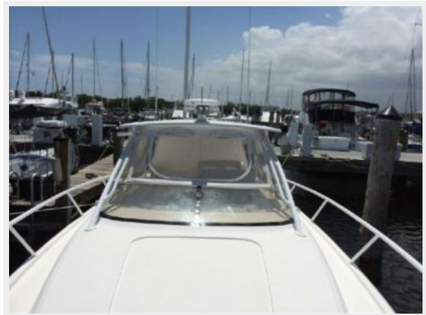
Facing Aft From Bow Pulpit