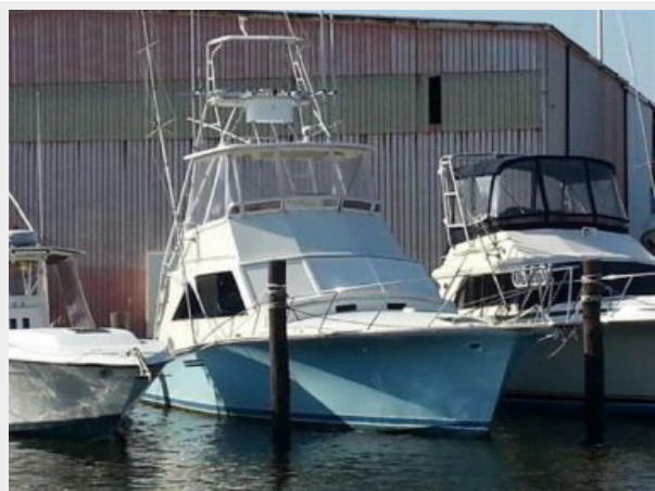
Forward View Profile