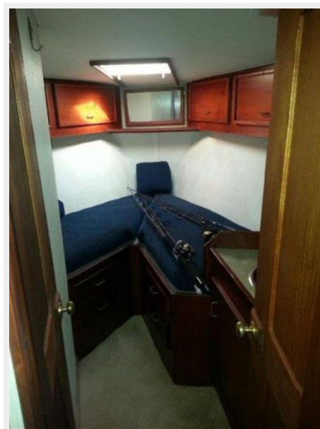
Master Stateroom 1