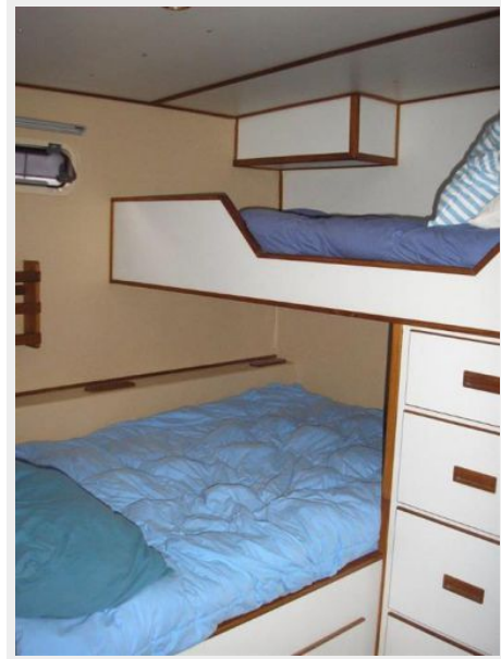
Starboard Guest Stateroom