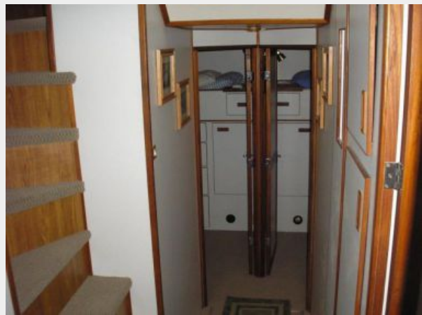
Aft to Twin Guest Staterooms