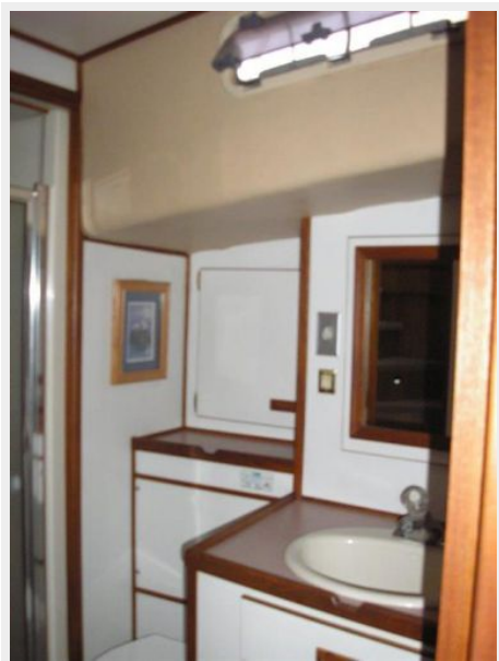
Starboard Head & Shower