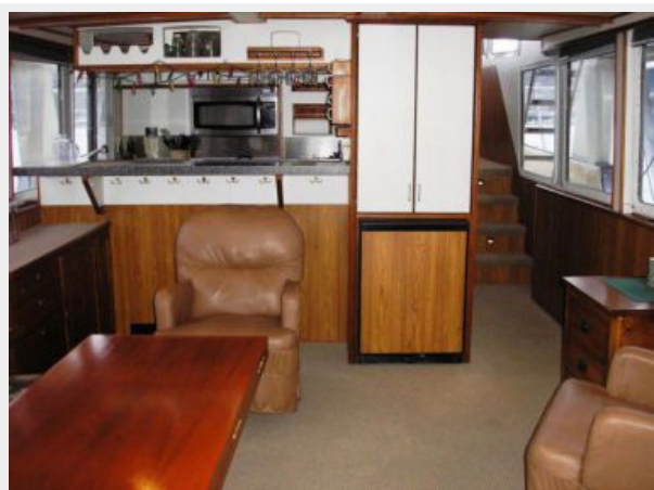
Salon View Forward