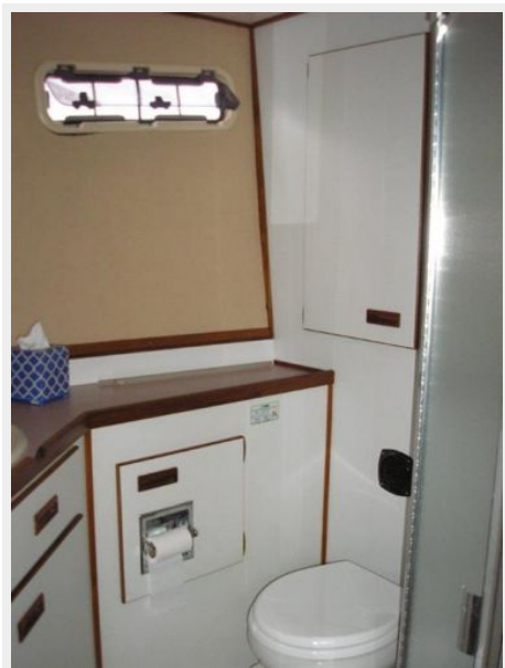
Port Head & Shower