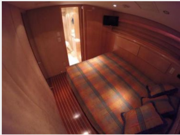
Master Stateroom facing forward