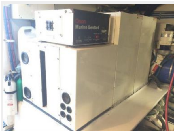
15 kW Onan Generator with 2238 hours