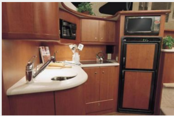
Manufacturer Provided Image: Galley