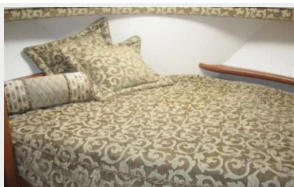
Forward Master Stateroom