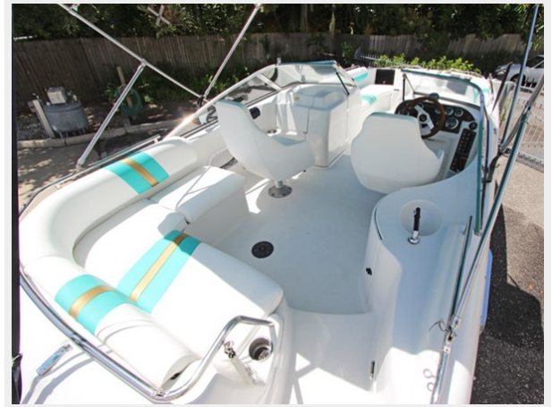
Large Cockpit W/U-Lounger