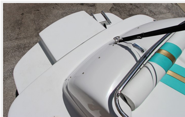
Large Integrated Swim Platform