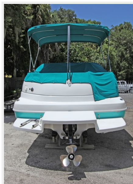
Transom View W/Swim Platform