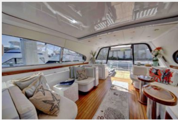
Upper salon 2