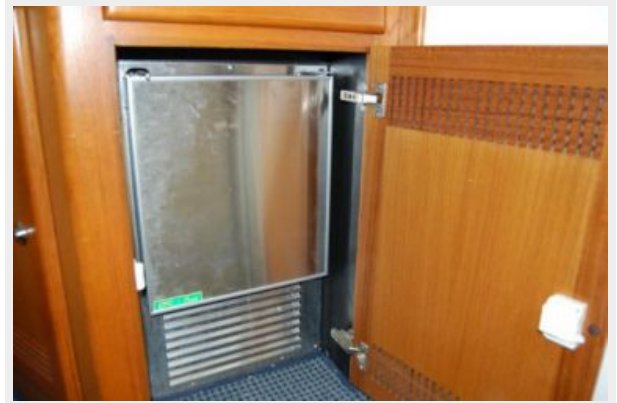
Salon Ice Maker