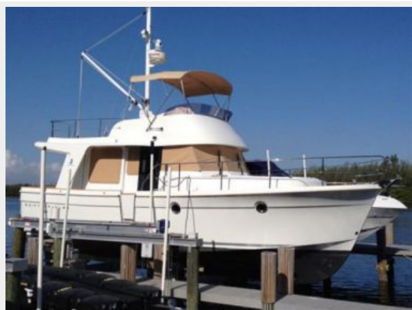
Lift Kept Since New