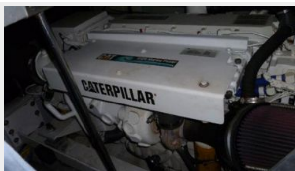
CAT 3126 Port Engine