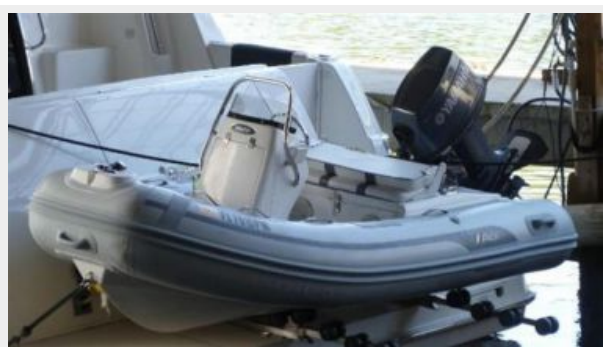
AB Inflatable tender w/40hp Yamaha