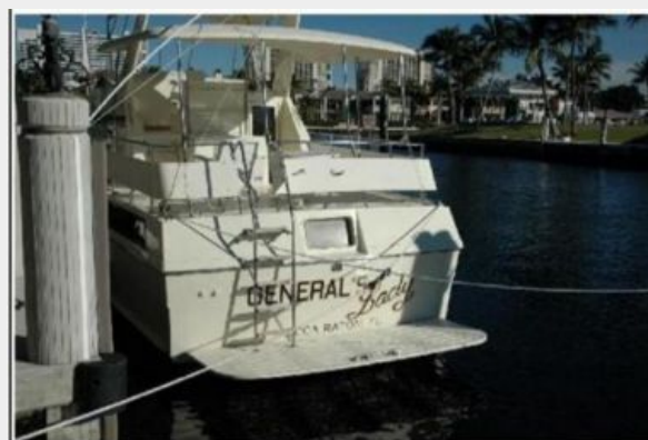
Transom and Swim Platform