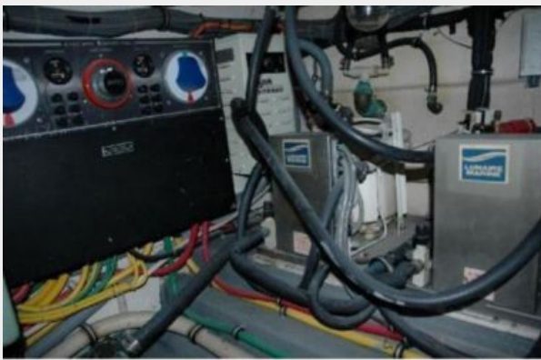
Air Con and Battery Switches