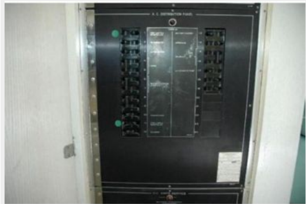
AC Electrical Panel Lower