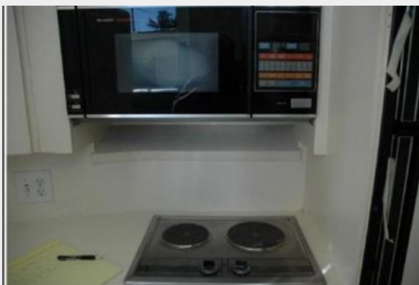
Stove and Microwave