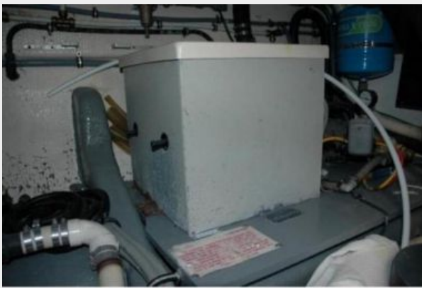
Hot Water Heater