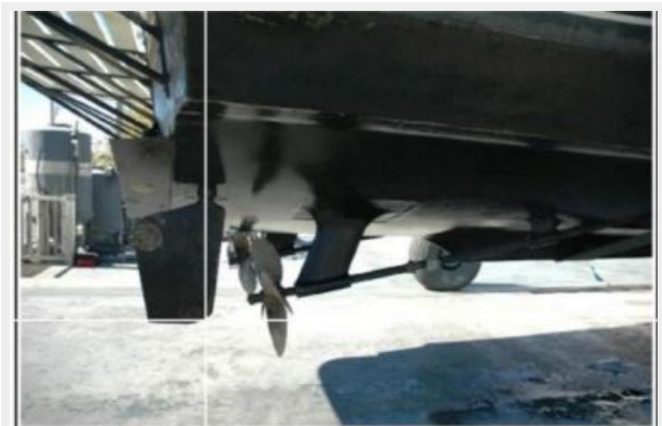
Starboard Running Gear