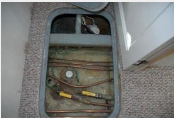
Keel Fuel Tank