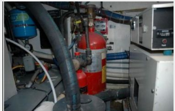
Halon Fixed Fire System