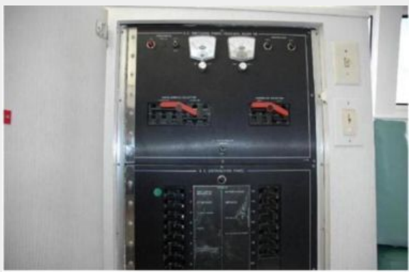
AC Electrical Panel