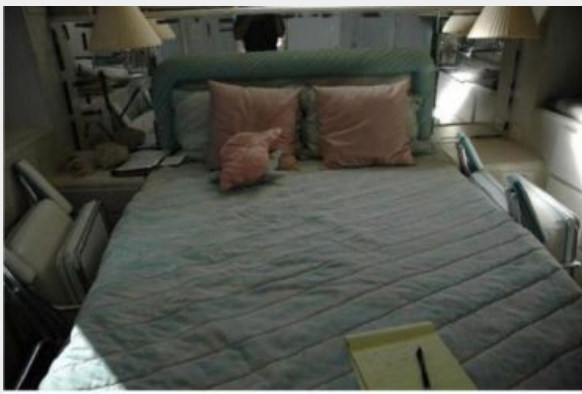
Island Queen Berth