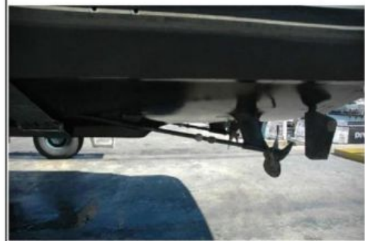
Port Running Gear