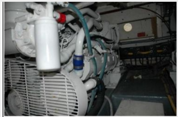
Starboard Main Engine