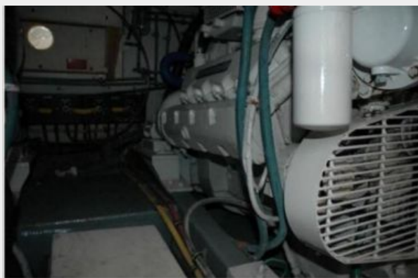
Port Main Engine