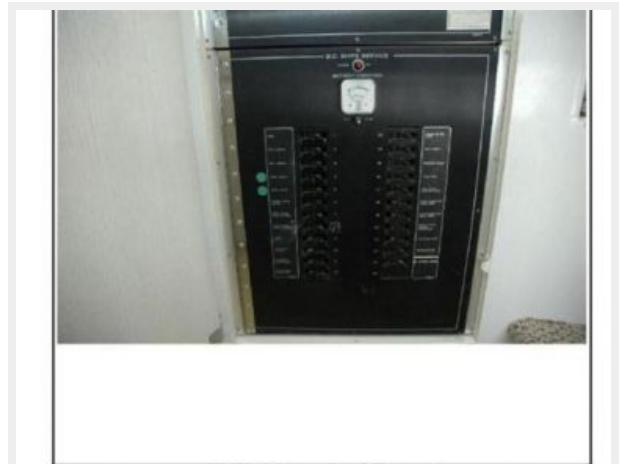
DC Electrical Panel