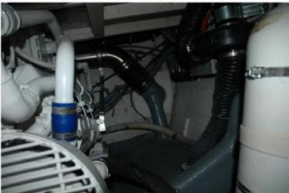
Main Engine Exhaust