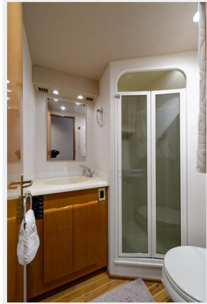
Forward Stateroom Head