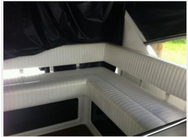
Cockpit seating (strb. side)