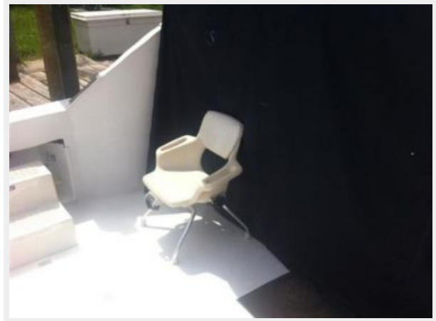
Aft seating/fishing chair