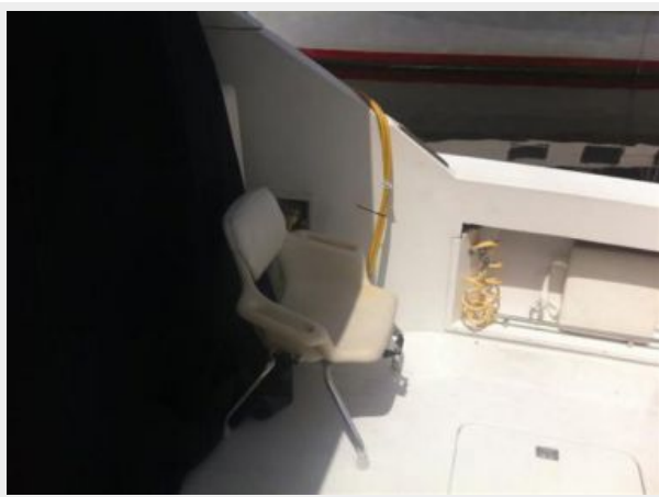
Strb. fishing chair (aft)