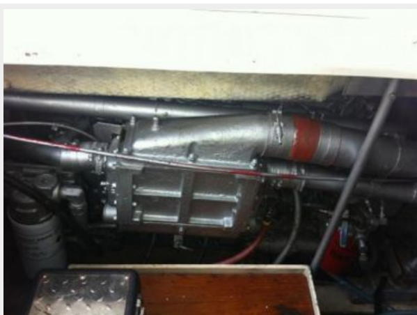
Engine room (strb)