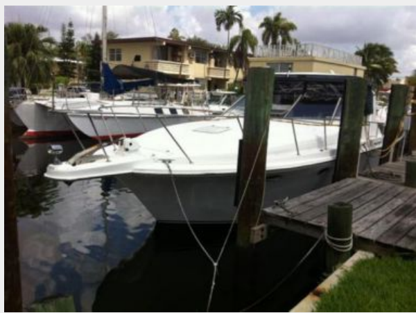
Port side view