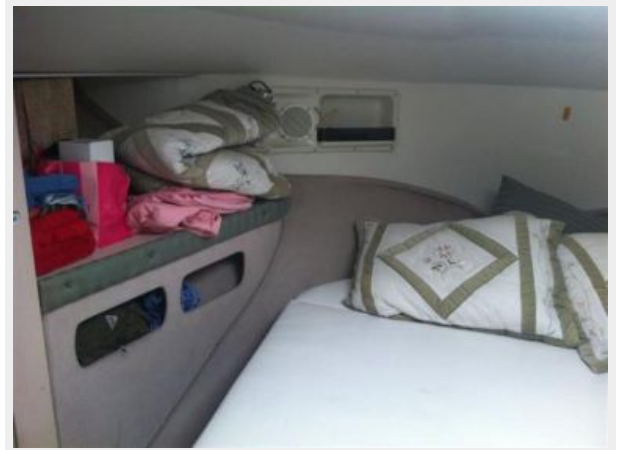
Master storage (port side)