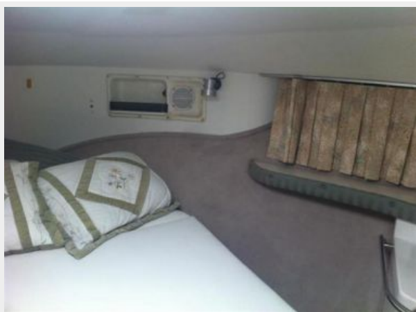
Master storage (strb. side)