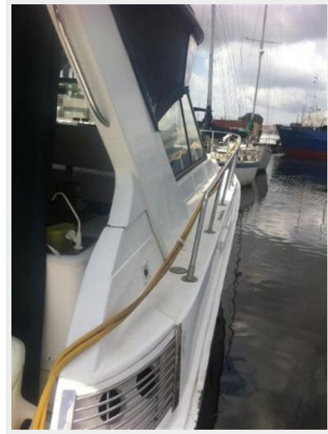
Strb. side aft-stern