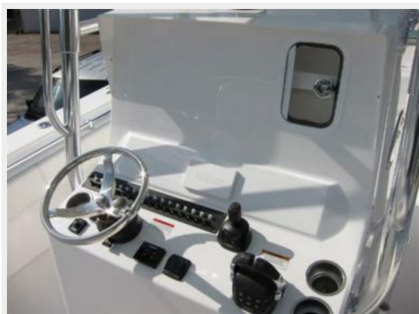
Helm w/ Joystick control