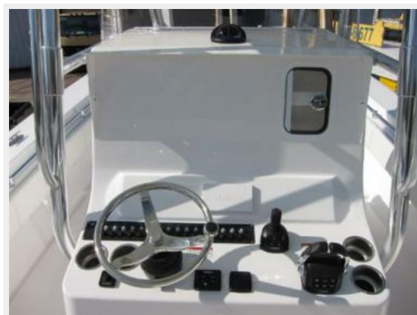
Helm w/ Yamaha Joystick control