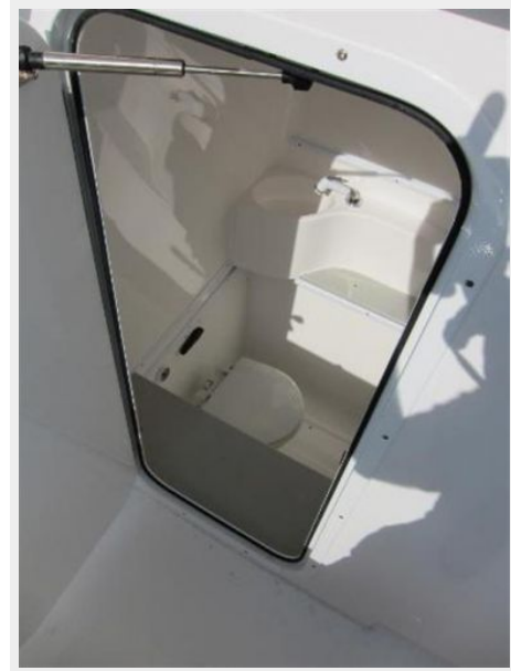
Head in console