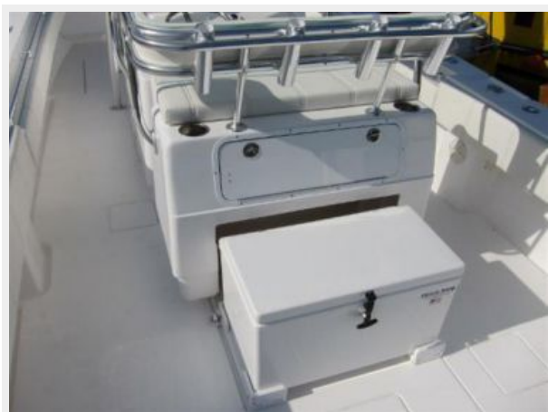
Slid out cooler