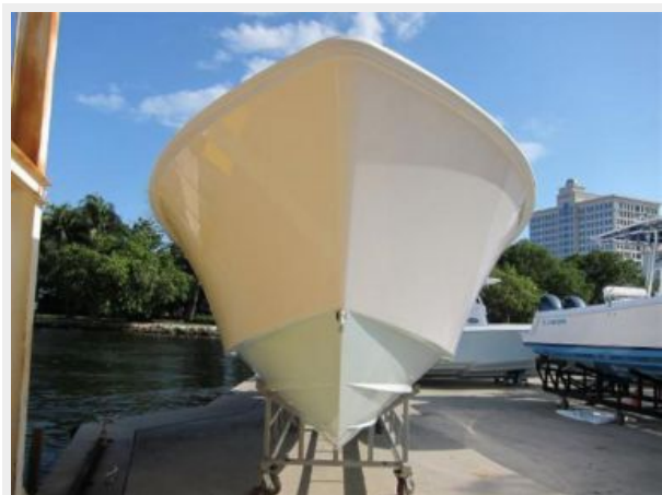
35 Contender ST