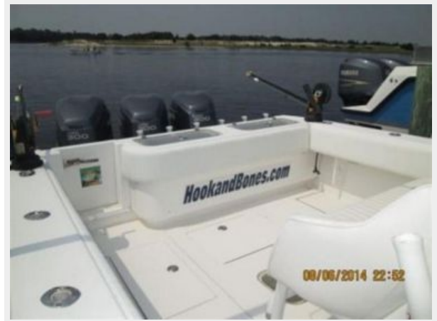
Contender 33 T