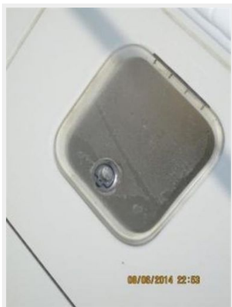
cockpit in floor 3rd livewell