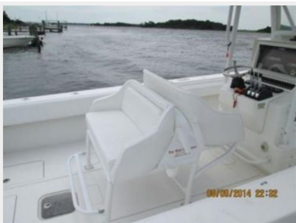
Custom leaning post and in floor 3rd livewell