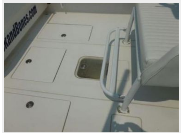
In floor livewell