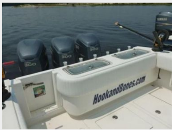
Twin transom wells