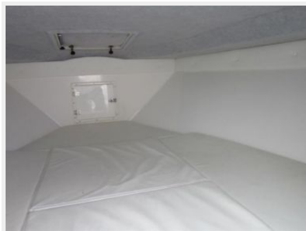
Cuddy Cabin Stbd