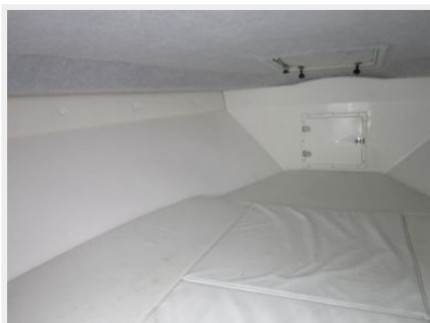
Cuddy Cabin Port