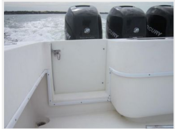
Dive Door to Transom