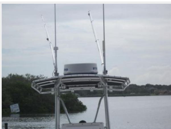
T Top Radar