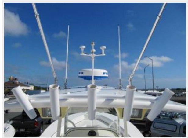
Hardtop Rocket Launcher / Antennas