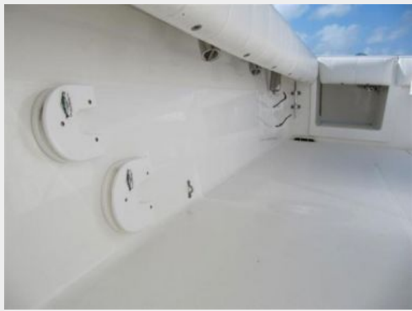
Starboard Under Gunwale