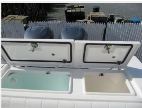
Live Well / Fish Box