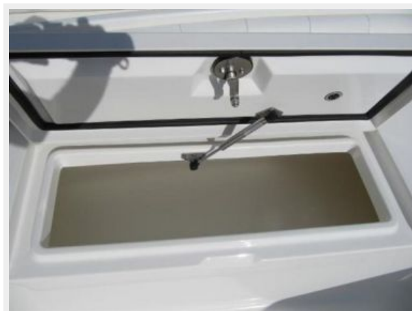
Starboard Forward Dry Storage