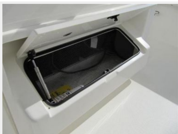
Battery Access / Storage