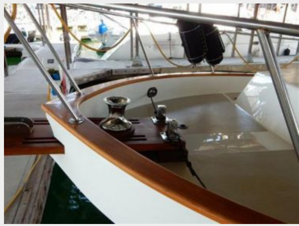
Bow and windlass