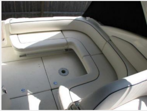
Deck 2 - Cockpit Seating