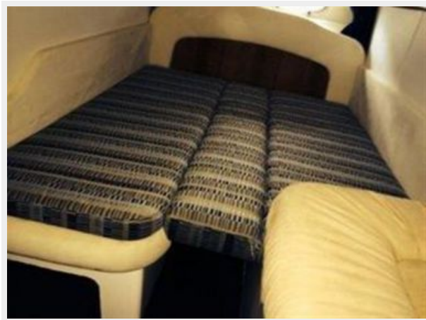
Guest Stateroom 1