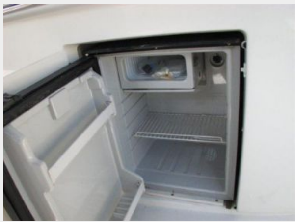
Deck 4 - Cockpit Refrigerator