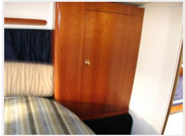
Master Stateroom 3