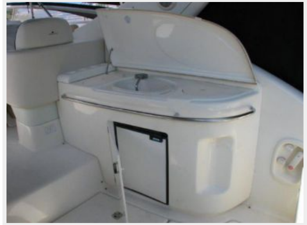
Deck 3 - Cockpit Wet Bar