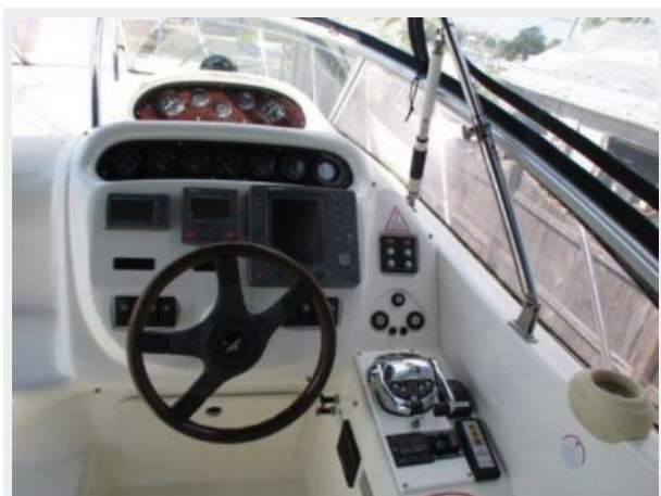
Helm / Electronics & Navigation