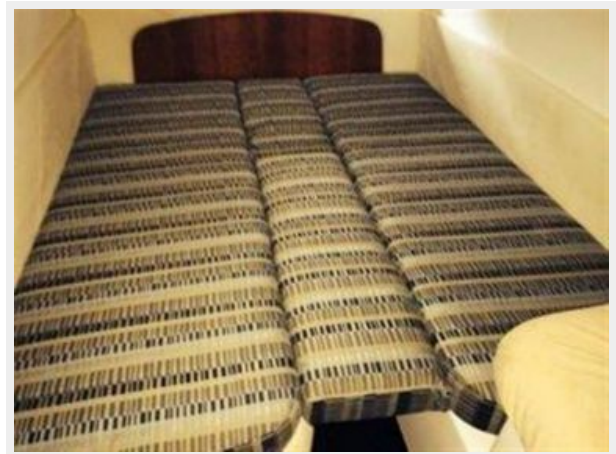
Guest Stateroom 2