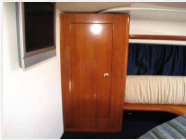
Master Stateroom 2