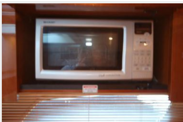
Galley Microwave / Convection Oven