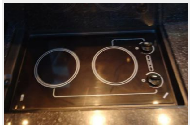
Kenyon Two Burner Stove