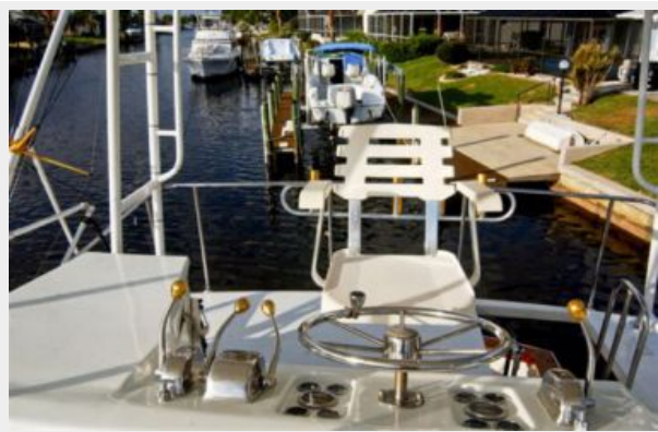
Full Flybridge w/forward seating