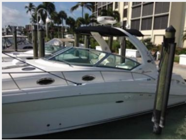
Port side with Radar arch