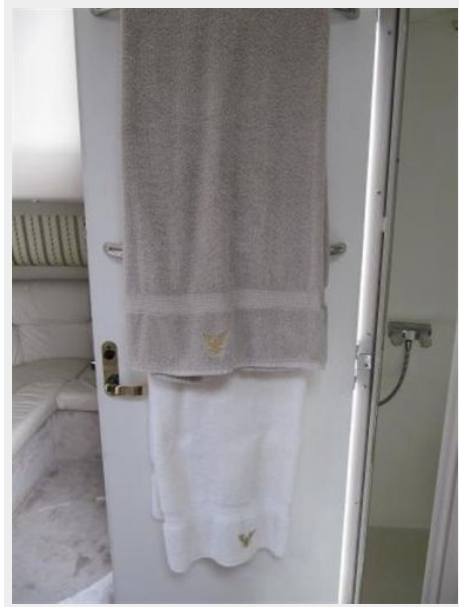
Door to Head