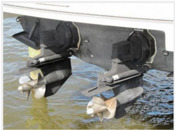
Out drives Trim Tabs