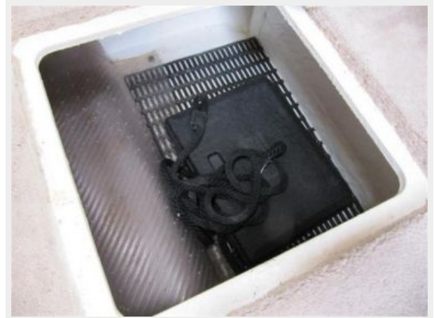
Below Deck Storage