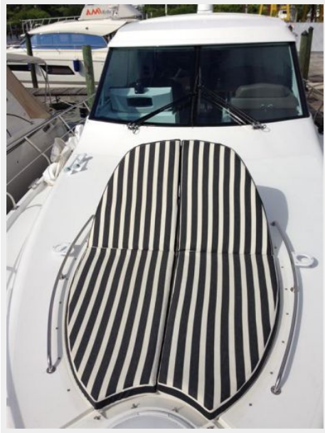
Bow Chaise Lounge