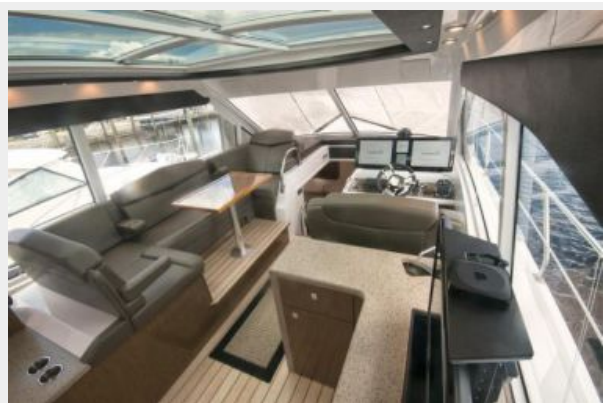
Upper Salon Forward