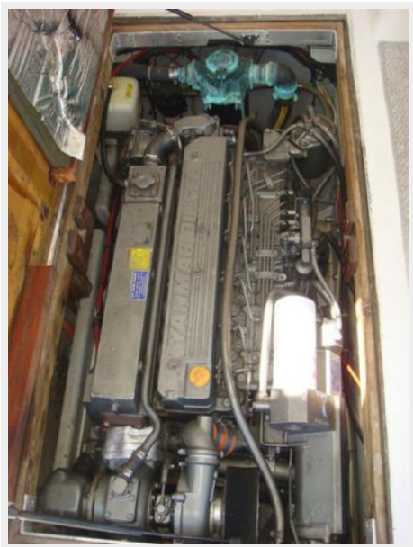
26' Pemaquid Beach engine compartment