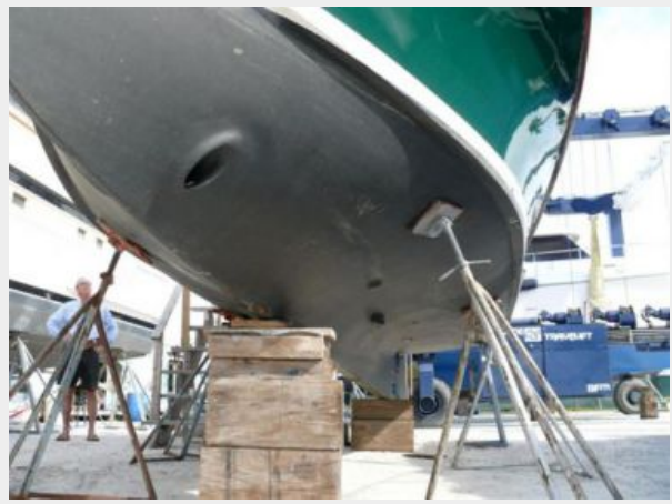
26' Pemaquid Beach hauled out photo1