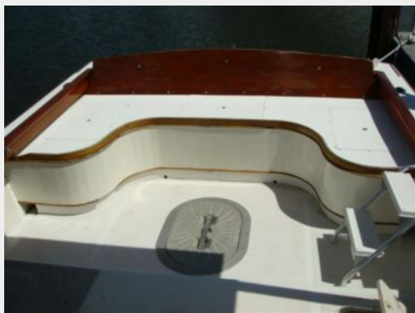
26' Pemaquid Beach cockpit aft