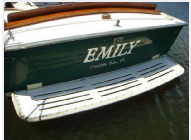
26' Pemaquid Beach swimplatform