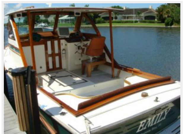
26' Pemaquid Beach aft profile