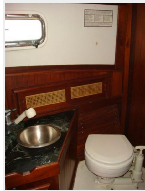
26' Pemaquid Beach head