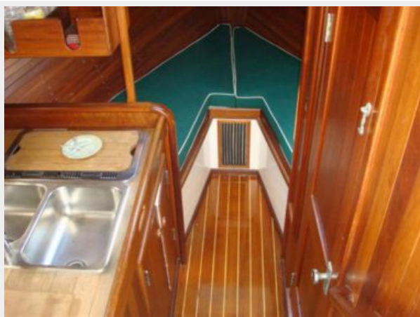
26' Pemaquid Beach interior forward