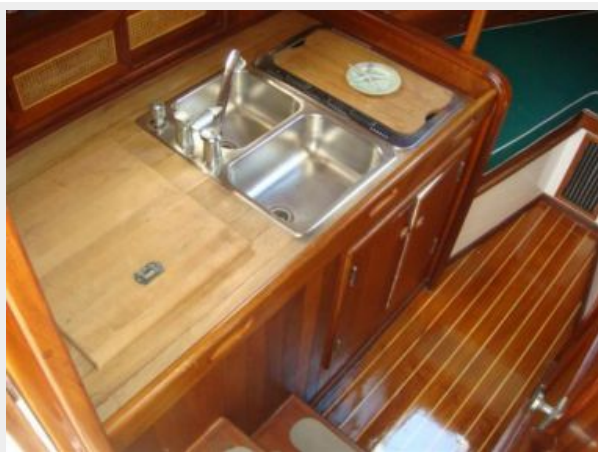
26' Pemaquid Beach galley photo1