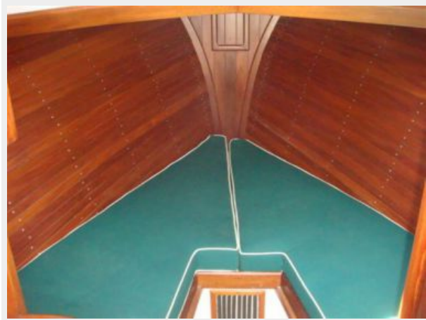
26' Pemaquid Beach stateroom