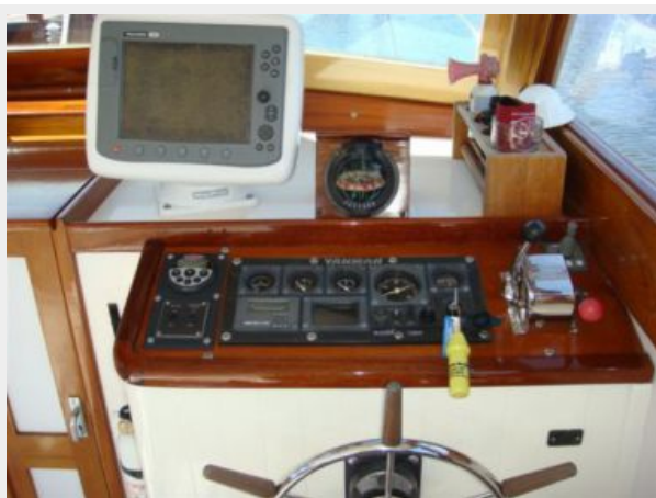
26' Pemaquid Beach helm photo2