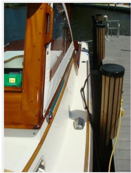
26' Pemaquid Beach port side deck