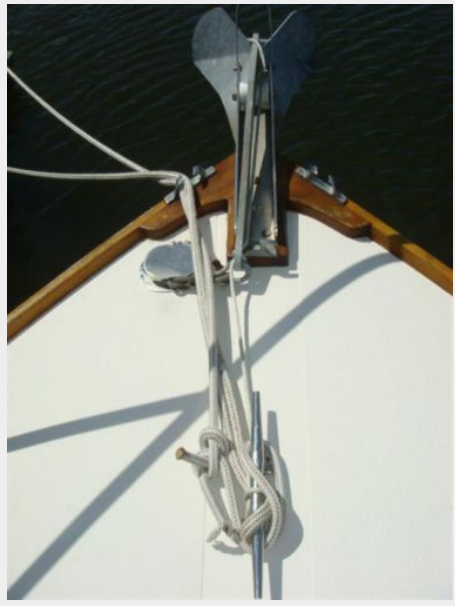
26' Pemaquid Beach anchor