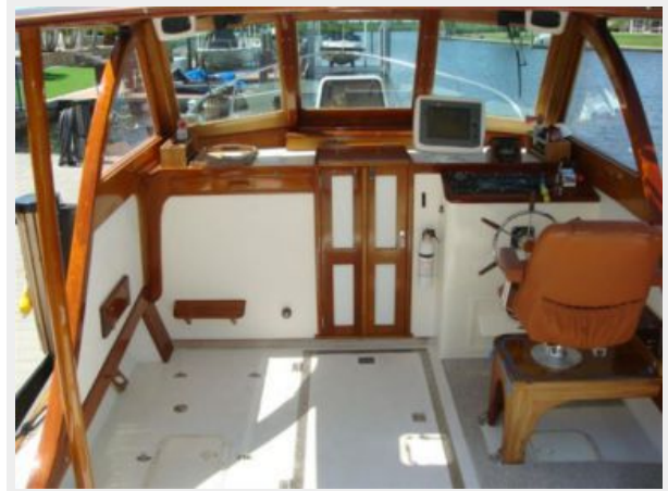
26' Pemaquid Beach cockpit forward