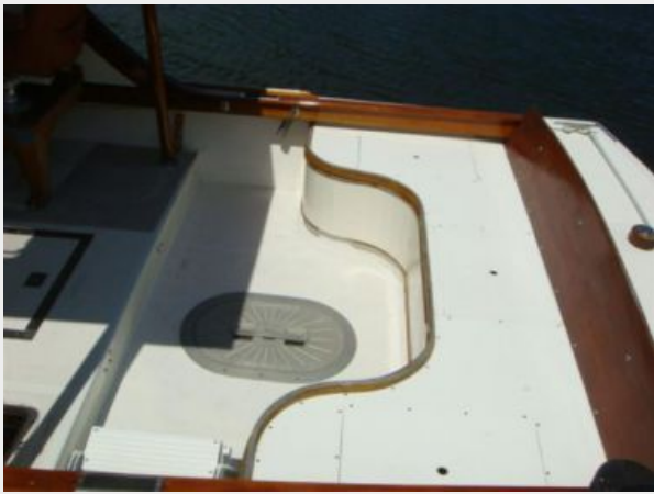
26' Pemaquid Beach cockpit seating