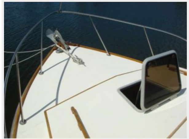
26' Pemaquid Beach port side deck