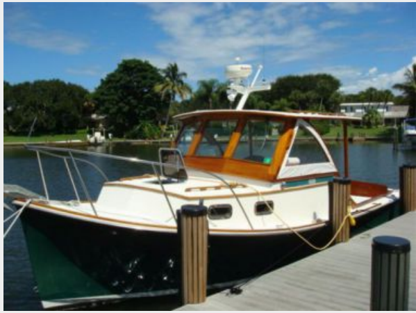
26' Pemaquid Beach port forward profile photo