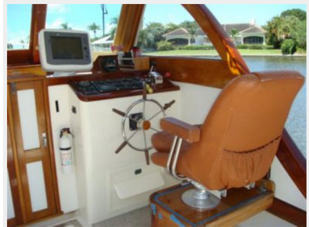
26' Pemaquid Beach helm photo1