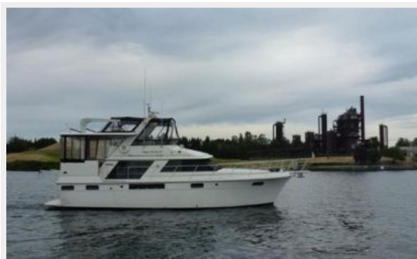
Starbord Side (Underway)