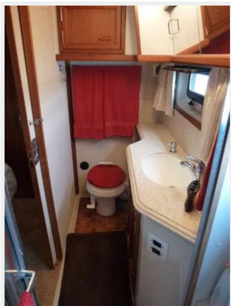
Aft Head 2