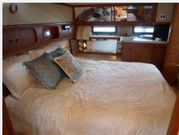
Aft Cabin bed