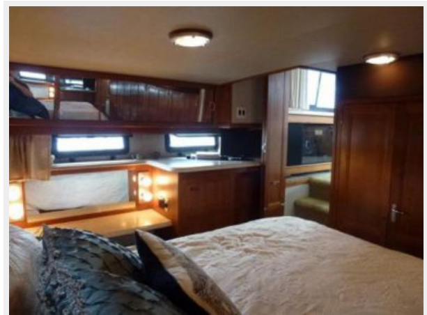
Aft Cabin 2