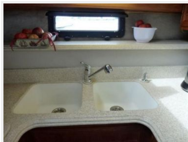
Galley - Sink