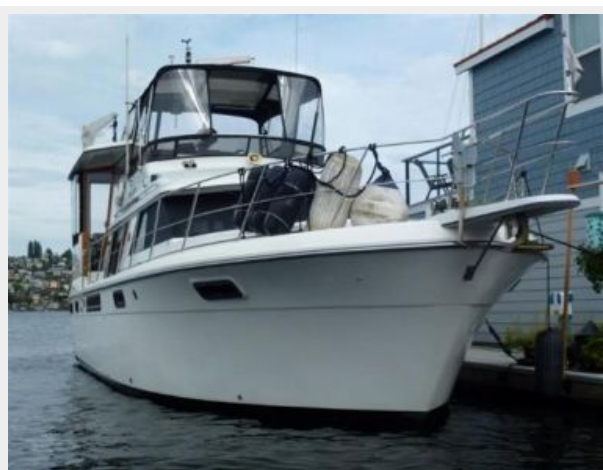
Port Bow (Docked)