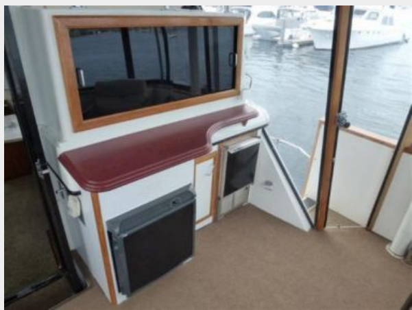
Aft Deck - Bar