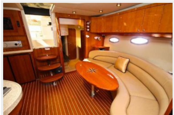
Salon & Dinette