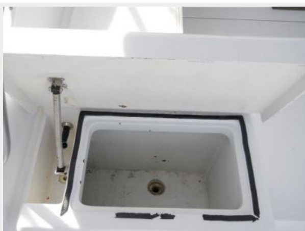
Insulated Drink Box/Fresh Water Rinse