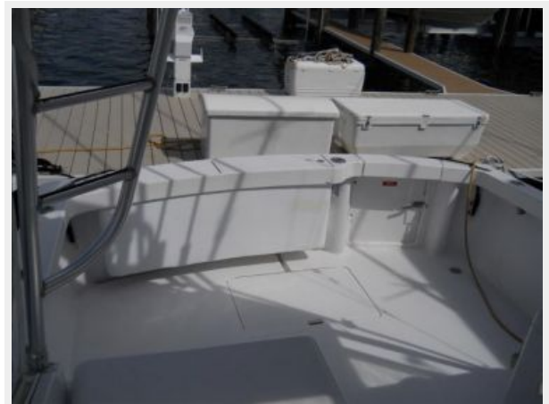
Insulated Fish Box